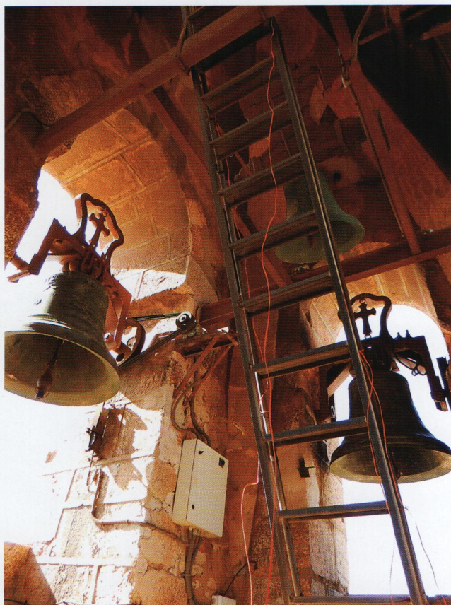
Sala de les campanes amb la Maria, la Pugera i la Burlana.

Des de fa segles, les campanes marquen el nostre dia a dia, el temps festiu i el dol. Un tret singular de Puçol és que cada campana té un nom popular , com si foren un veí més del poble. D'aquesta forma, de més menuda a més gran, trobem la Burlana, la Marinera, la Saguntina, la Pugera i la Maria.