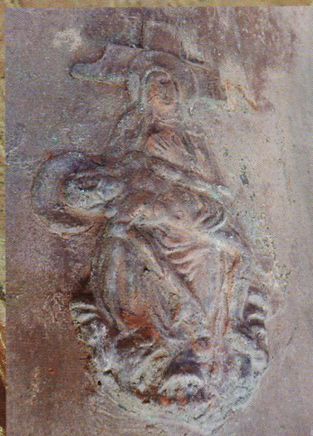
Imatge de la Mare de Déu al Peu de la Creu. Detall de la Maria.