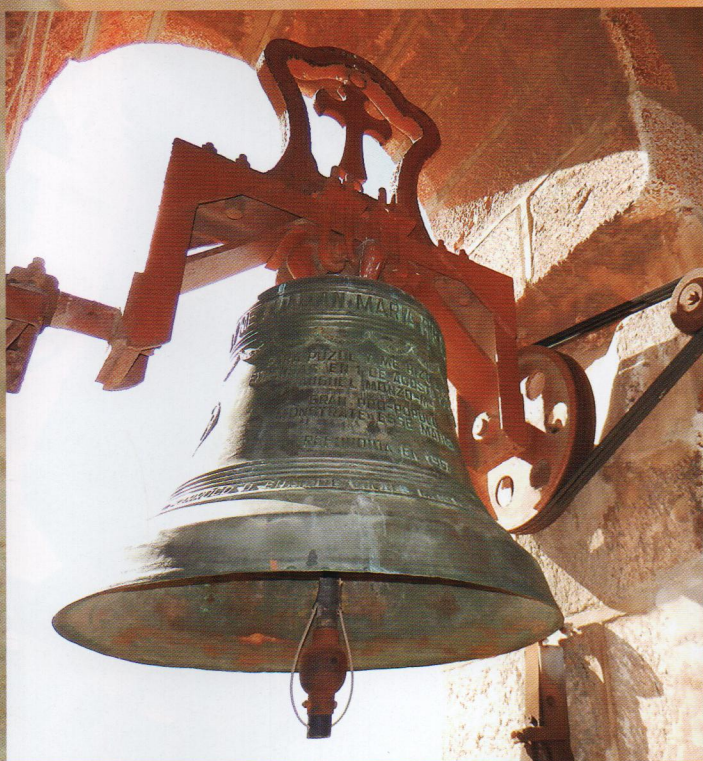
La Pugera amb la truja de ferro i mecanismes de toc automàtic.