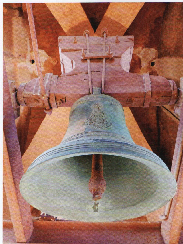
La Burlana, Mare de Déu del Remei. Conserva la instal·lació tradicional.