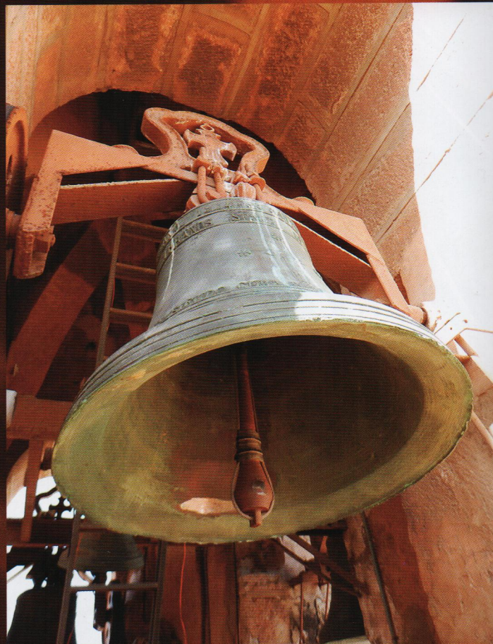
La Marinera, Sant Tomàs d'Aquino.