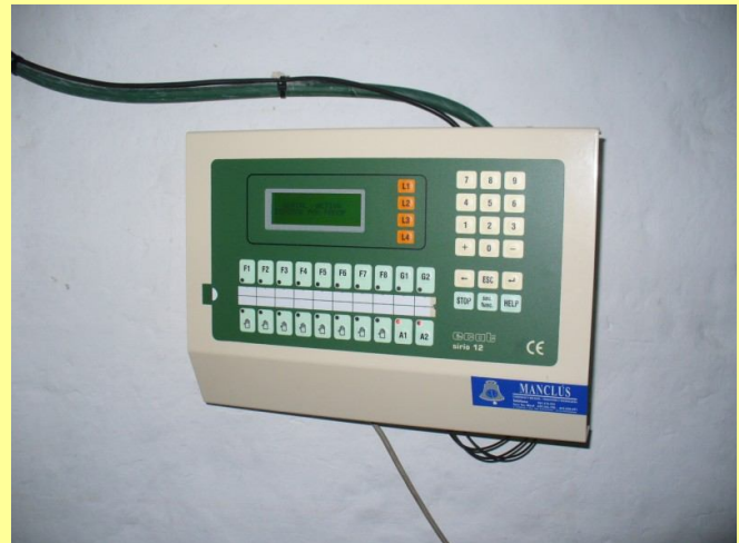
Nou comandament dels tocs de les campanes

Recentment (2012) el batall de la campana grossa va caure sobre la teulada de la Casa Abadia. Va coincidir amb una avaria del rellotge del campanar. Així es que es va decidir baixar novament les campanes per reparar-les. Tal cosa es va efectuar el dia 10 de juliol de 2012. Després d'estar el poble uns dies sense campanes aquestes van retornar al poble el 25 de Julio, dia de Sant Jaume. Els dos dies, però sobre tot el dia en que tornaven les campanes completament noves i relluents van ser una festa. La gent es va arremolinar al costat del campanar observant com una