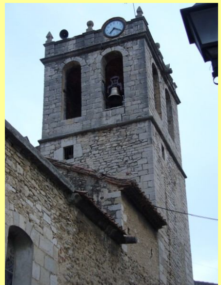
Campanar, 2012- Nord