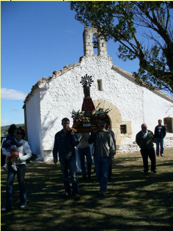
Ermita del Pilar (1625)