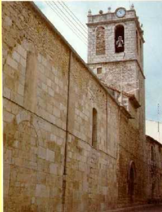
El campanar, anys 1990

Té una capacitat màxima de vuit campanes, encara que històricament tant sols n'ha tingut quatre o tres, com en l'actualitat. Es quadrat, de pedra picada i està edificat sobre l'arc principal del Cor, completament pla, i sobre les parets laterals.