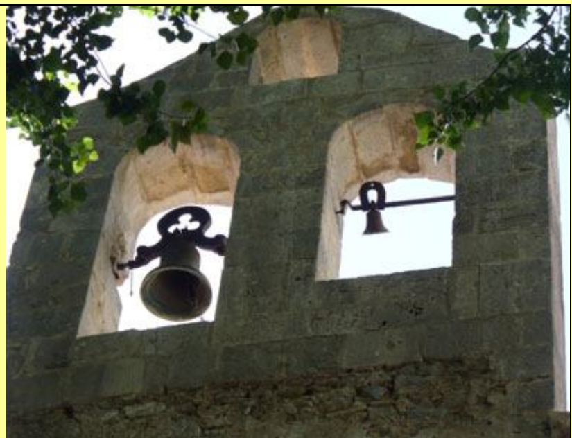
Hi ha dos campanes, encara que la menuda no té corda.