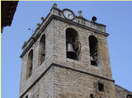
Campanar sud i oest

També s'han destapat tres de les arcades de mig punt que estaven tapiades total o parcialment. Queden dos arcades encara tapiades i tres ocupades per campanes (*).