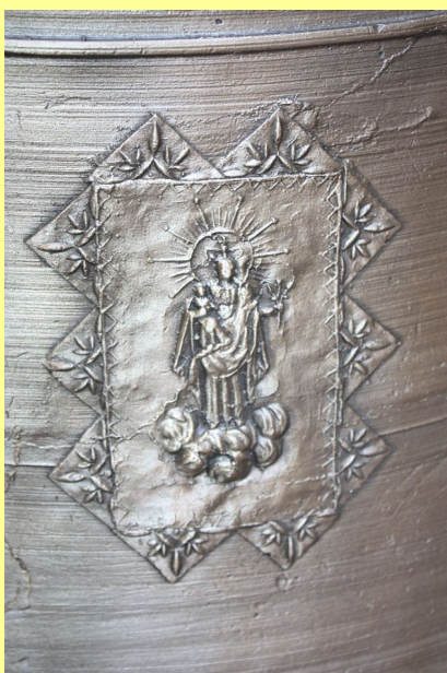
Epigrafia en campana grossa

Caldrà estudiar la possibilitat de tapar de nou, amb noves tecnologies, les obertures del campanar si algun d'aquestos efectes es demostra evident i perjudica la seua sonoritat o causa humitats en l'església (*).