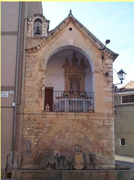
Font Nova o de Sant Vicent

Actual campaneta de la capella de la Font de Sant Vicent traslladada l'any 1992 amb el permís del bisbe de Tortosa des damunt del portal a l'actual emplaçament (Veure més endavant portal de la Font Nova o de Sant Vicent)