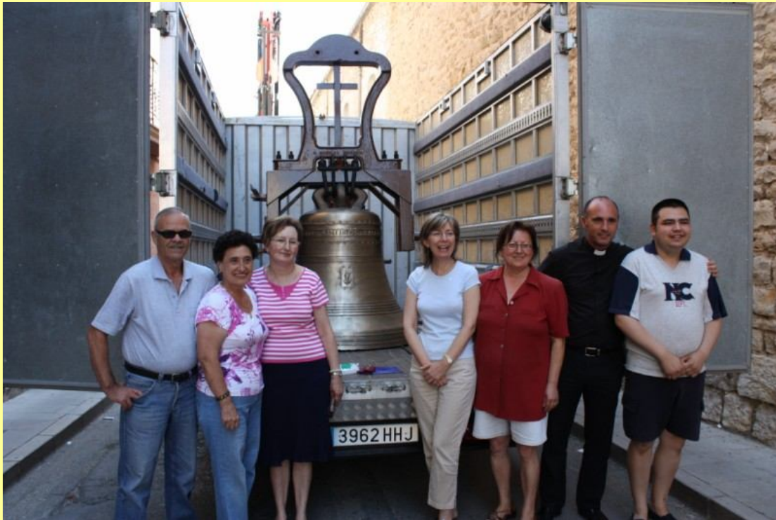
Dia de la pujada de les campanes (25 juliol 2012)

moderna grua feia ràpidament el treball que abans costava tant esforç de fer. Al mateix temps van ser molts els que van aprofitar l'ocasió per a retratar-se al costat de les campanes. L'opinió majoritària de la gent era de que a nivell de terra semblaven molt més grans i relluents que al campanar.