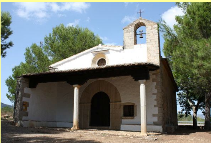
Ermita de Santa Anna (1446)