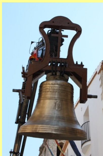
Pujada de la campana grossa