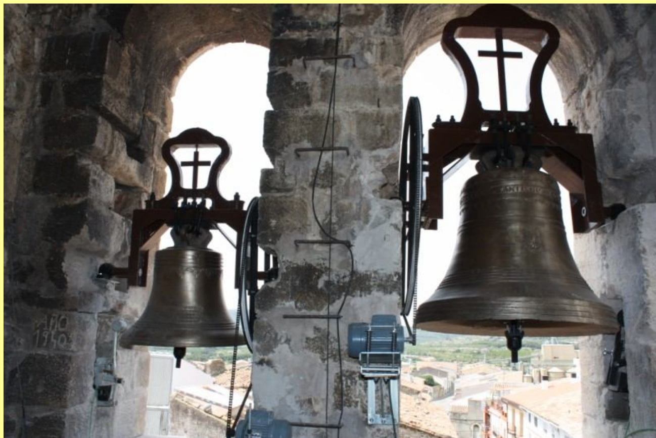
Les campanes grossa ("Maria Rosa") i mitjana ("Sant Josep") des de dins del campanar.

Dimecres 2 d'octubre. - A les dotze es col·loca al seu lloc i es toca en ella l'Ave Maria. A les dos i mitja es beneïda per tot el clergat a la torre. Va estar tocant fins dissabte i, amb aquest motiu, es va torejar per tot el poble, i es va matar aquest dissabte, una vaca de Vallivana.