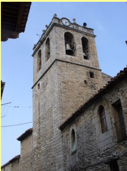
Campanar, 2012- Sud

Té una capacitat màxima de vuit campanes, encara que històricament tant sols n'ha tingut quatre o tres, com en l'actualitat. Es quadrat, de pedra picada i està edificat sobre l'arc principal del Cor, completament pla, i sobre les parets laterals.