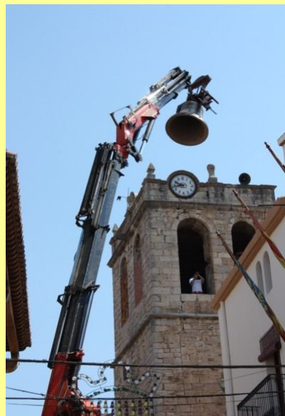
Pujant les campanes