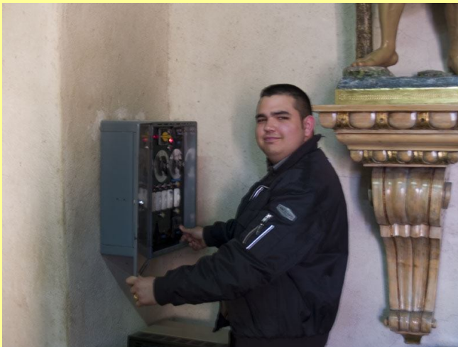
Tocant les campanes (Sant Martí, 2007)

La darrera vegada que es van baixar les campanes, després de la guerra, va ser en 1976, fa ara uns 36 anys, amb Mossèn Joaquín. Es va substituir el sistema manual de cordes i el de pujar al campanar per a tocar les campanes "al vol" per un sistema elèctric, automàtic i més còmode de voltejos i repics. Per a alguns es va perdre la màgia i encant de l'antic sistema manual i de l'esforç artístic dels campaners per un altre més impersonal, monòton i menys romàntic. La comoditat però, acabà imposant-se.