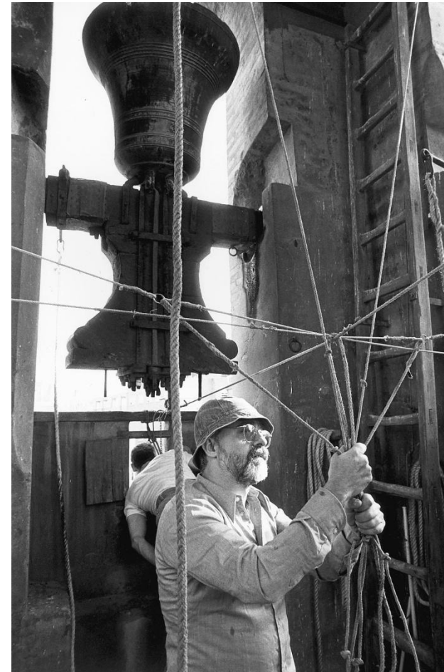
Tocs al Col·legi del Corpus Christi de València. 1990.

Gremi de Campaners Valencians, que es va estendre a altres municipis.