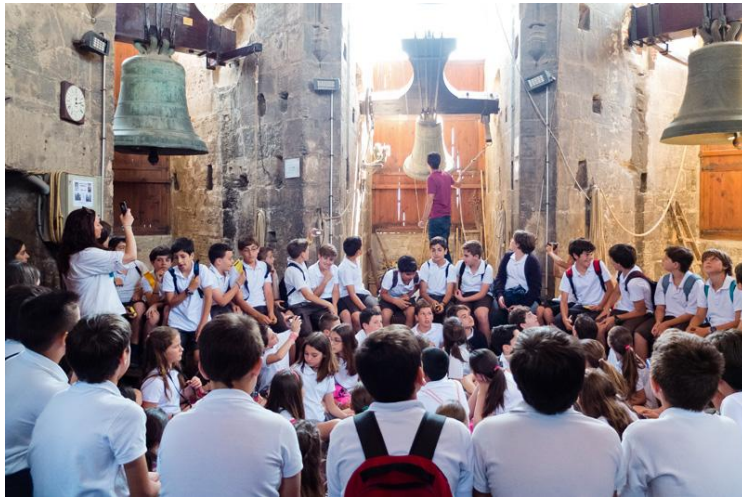
Les experiències didàctiques a la Torre del Micalet. (autora; Belén Monreal).