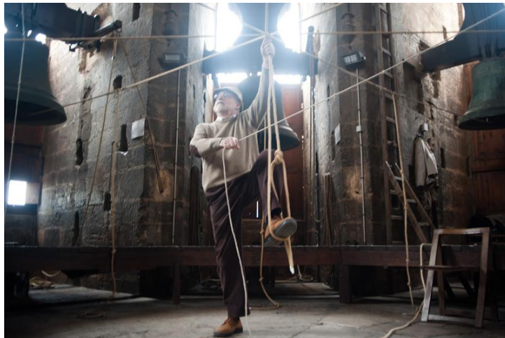
Tocs manuals de campanes, repicant amb peus i mans. (Autor: Eliseu Martínez Roig).