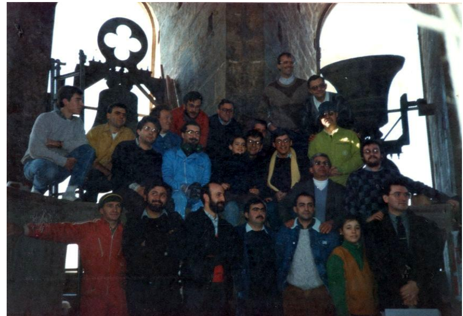
Fundació del Gremi de Campaners Valencians, a la Torre del Micalet. El grup de la Catedral passarà a nomenar-se "Campaners de la Catedral de València" en 2004 (foto 22-01-1989).