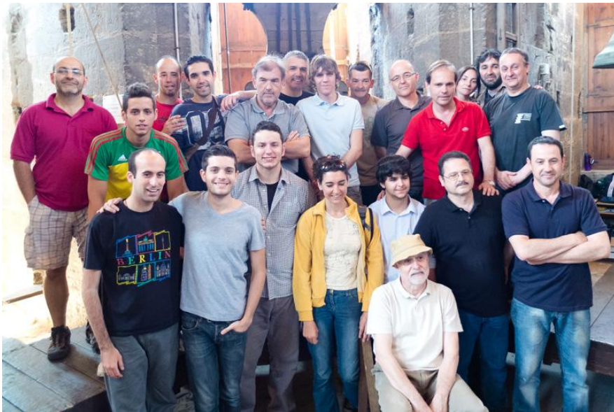
Campaners de la Catedral de València. El grup de campaners actual.

rere any s'acosten a participar de la creació musical in situ , als mateixos campanars o als voltants, i que fins i tot reconeixen els tocs, de manera que poden interpretar si els campanars han estat afinats o no.