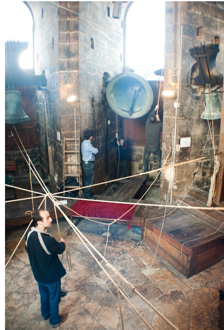
Tocs manuals de campanes, combinació de tècniques, campanes voltejades i repicades. (Autor: Eliseo Martínez Roig).