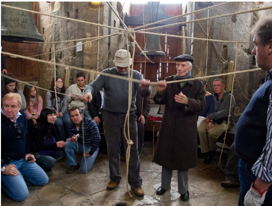
La transmissió del coneixement entre generacions.

excepció de les normatives de soroll (ja que les campanes no fan soroll, sinó música alta). Inclús reconeixements significatius a escala internacional recauen ací, com la Menció Especial del Jurat d'Europa Nostra 2016, que reconeix la tasca dels Campaners de la Catedral de València.