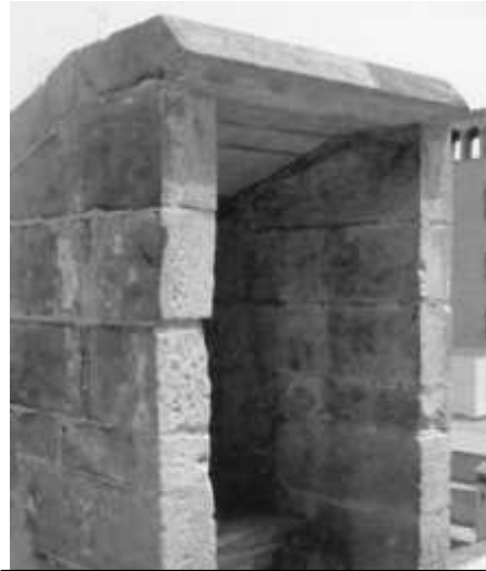
Comuna dels campanars de la catedral de Barcelona.

De moment el tap segueix desaparegut, però un compassiu fuster va obsequiar-nos amb un tap idèntic al robat, tot i que nosaltres seguim esperant que algun dia aparegui el medieval; seria una llàstima que no tornés! Però es veu que hi ha qui no té ganes d'esmena i té molt