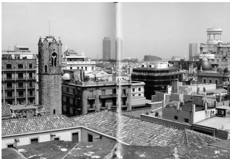
Campanar de l'església de Santa Àgata

Al nostre antic bisbat de Barcelona eren actives aquestes torres rurals dels comunidors fins fa ben poc. Així ens trobem a moltes de les parròquies que hem estudiat en el Catàleg Monumental de l'Arquebisbat de Barcelona ; concretament en el volum que descriu les parròquies del Vallès Oriental (1982) hi ha les del Montseny. Avui dia encara funciona com a comunidor el de la Costa (del Montseny), que ve representat en la portada de l'esmentat llibre - catàleg- publicat per l'Arxiu Diocesà de Barcelona.