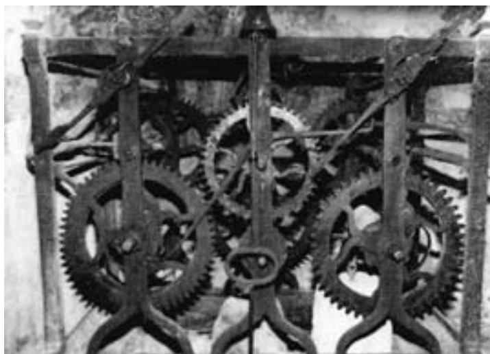
Fotografia del rellotge del campanar apareguda amb l'article de Domènec Escudé.