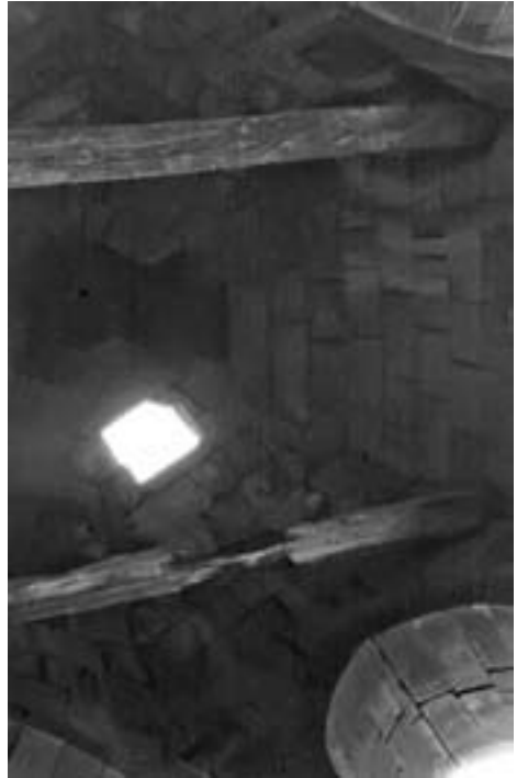
Volta interior del campanar, amb l'obertura per sortir a dalt, al terradet (Foto Jaume Fortuny. Arxiu J. Fortuny).