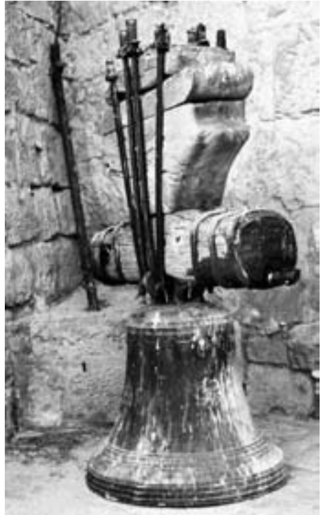
La campana "vella" baixada del campanar.