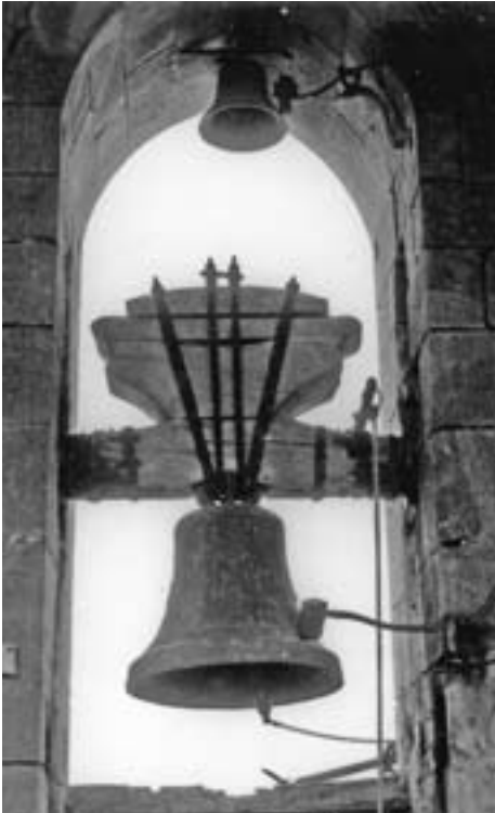
La campana "vella" a dalt del campanar.