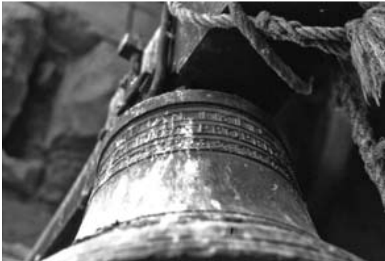
Campana petita del campanar; abans sembla que es trobava a la part davantera de l'església, damunt del portal. És de les antigues.