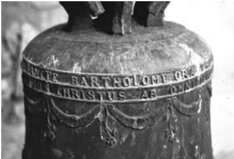
Detall de les inscripcions de la campana "vella".