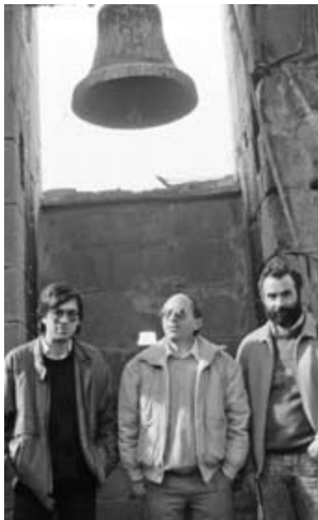
De visita al campanar, cap al 1980. (Foto i arxiu J. Fortuny).