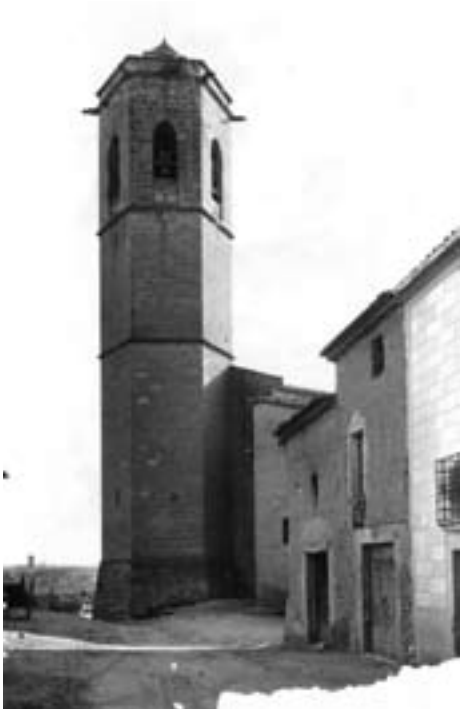
Imatge del campanar de l'església parroquial de Bellpuig, l'any 1936 (Tarja postal Impremta Saladrígues).