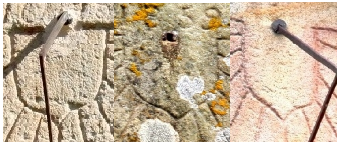
Resconorio (1855), Carrascal de Cocejón (1859), Sel de Manzano (1863).

Hay otro reloj de sol del siglo XVIII con escudete en la iglesia de La Riva, pueblo cercano a Corconte, que no presenta ninguna de las características de clasificación enumeradas, si exceptuamos que está grabado en un sillar exento pero carente de frontón. En Cantabria el escudete distribuidor perdura en contados casos hasta mediados del siglo XIX.