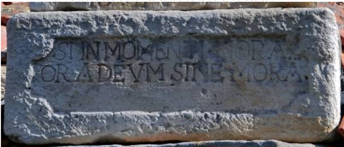
Base de piedra del reloj de sol. Leyenda en latín.

SI IN MOMENTI HORA... / ORA DEVM SINE MORA