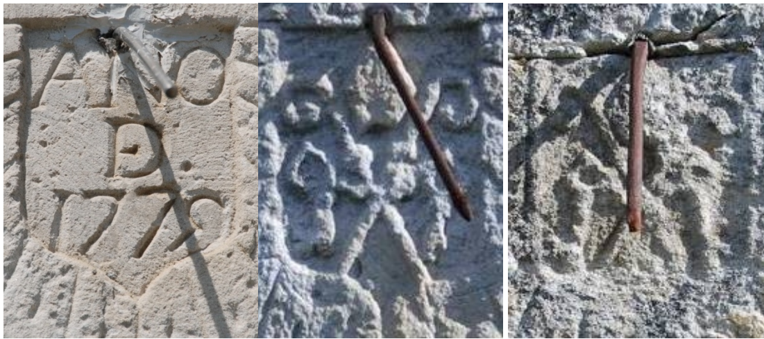
Bercedo (1775), fecha original - Brizuela (1783) - Escaño (1784)