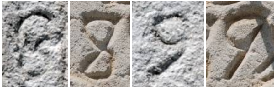
Cifras 8 y 9 en las horas y en la fecha.

La cifra 1 de la fecha con la forma de la I romana es muy rara en relojes de sol de finales del XIX, le falta el pequeño trazo inclinado superior. En los restantes relojes la cifra 8 en bucle abierto se utiliza tanto en la numeración horaria como en la fecha, aquí sólo en la fecha se utiliza la cifra 8 cerrada. El 9 de la fecha es recto; sin embargo, el de la hora es curvo. En la cifra de las unidades encontramos la solución a tanto anacronismo: el cinco falciforme invertido se transformó en 9. Y si miramos con atención las cifras de las decenas y las centenas, advertiremos que también se han modificado.