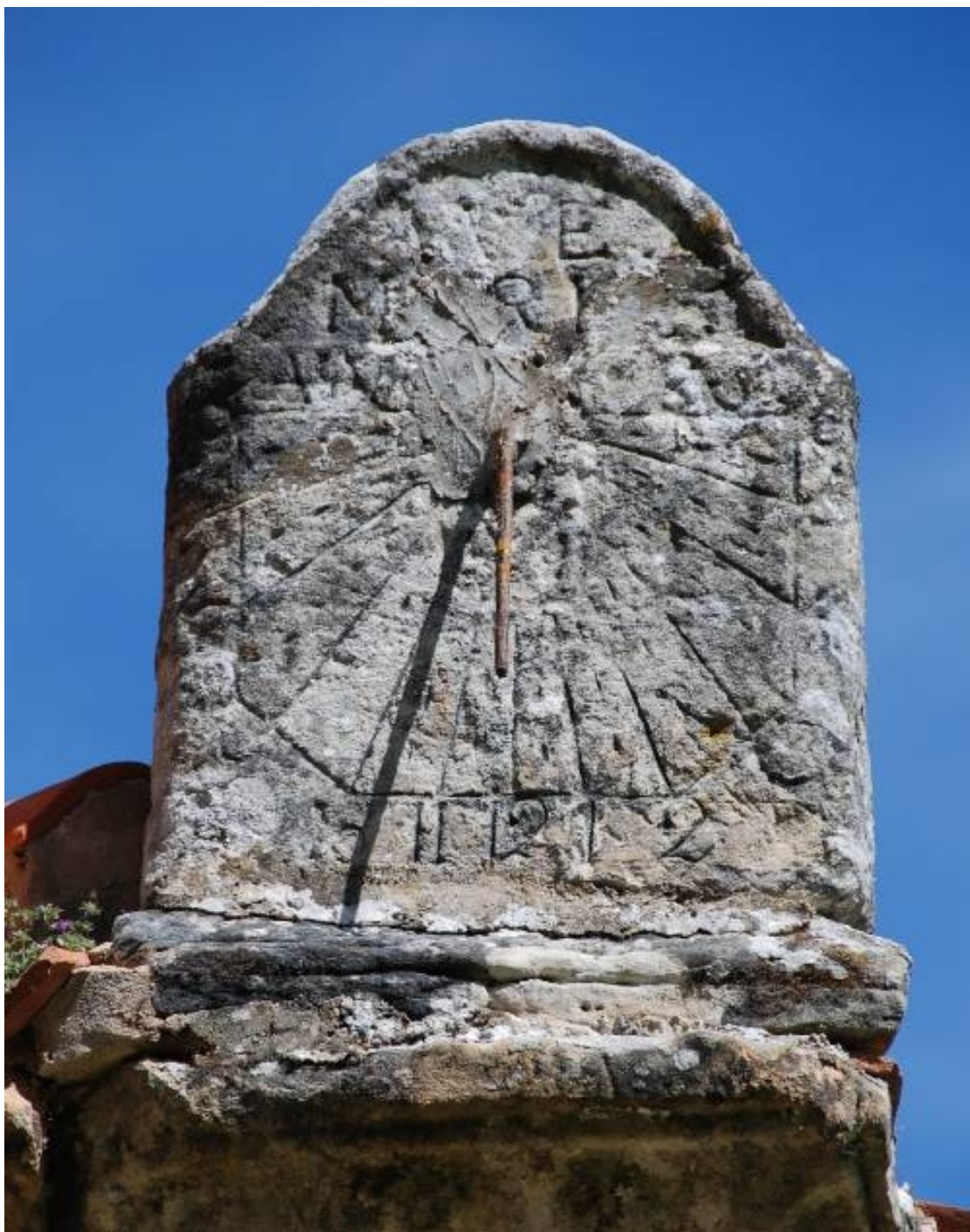
Rectangular horizontal con las esquinas inferiores cortadas. VMO.

Grabado en una placa exenta rematada en frontón campaniforme, apoyada sobre la cornisa del tejado en la esquina sureste de la cabecera. Marco rectangular simple con las dos esquinas inferiores cortadas a bisel. Escudete distribuidor tapado parcialmente con cemento. Horas en números arábigos, de 6 de la mañana a 6 de la tarde. Líneas de medias horas de trazo discontinuo. Varilla de apoyo único. Leyenda inscrita en el frontón: AVE MARIA. Fecha bajo el frontón: AÑO DE 1785.