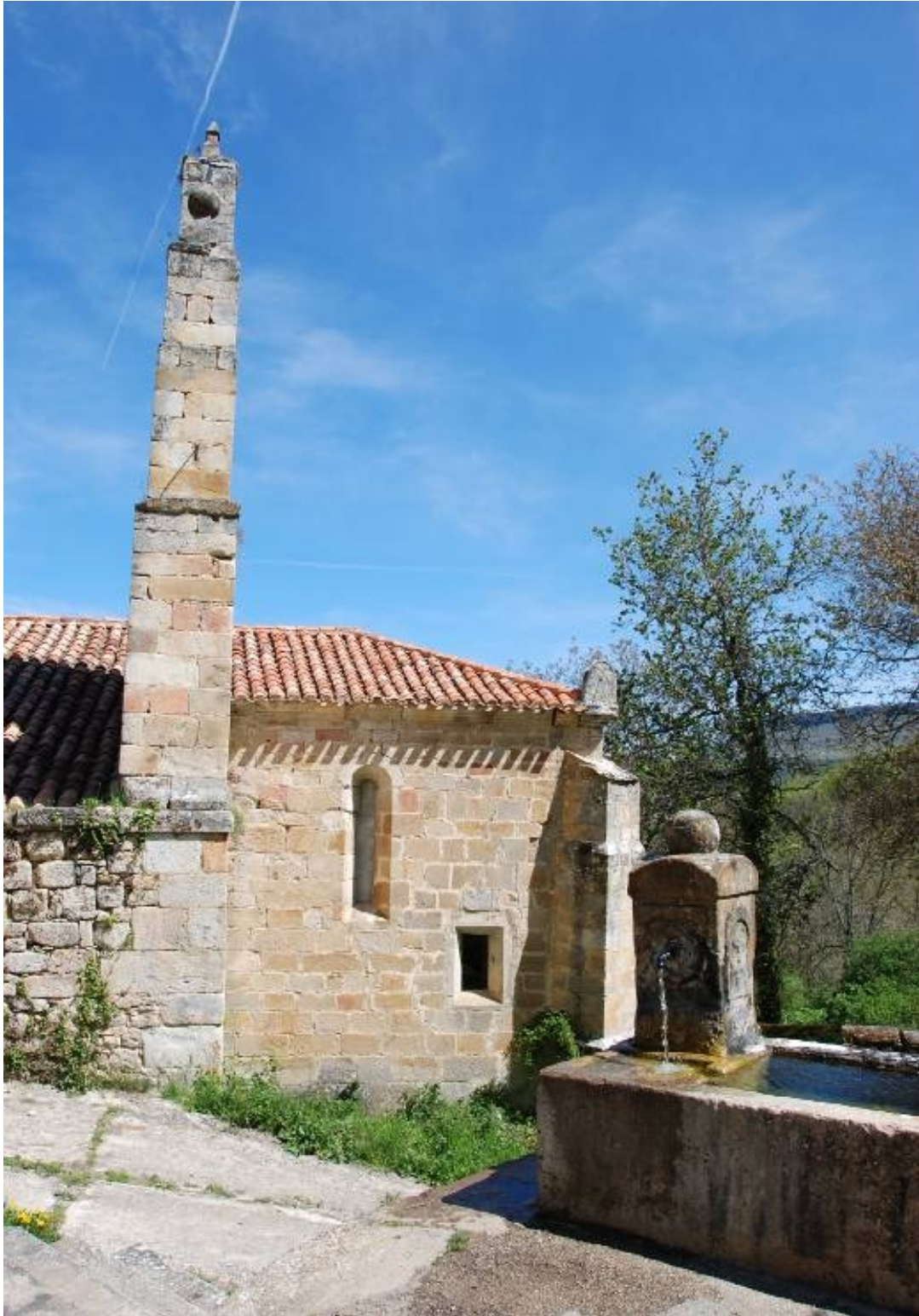
Reloj exento situado sobre la cornisa en la esquina sureste de la cabecera.

Vertical a mediodía orientado. Año 1785.