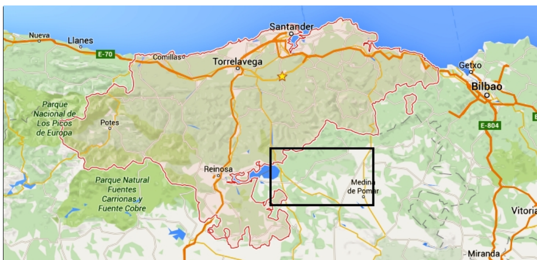
Maestro cantero de Corconte. Localización de los relojes de sol. Fechas.

Además del singular escudete distribuidor, hay un conjunto de características que, con contadas excepciones, se repiten en todos los relojes de sol de este conjunto: grabados en placa de piedra exenta rematada en frontón campaniforme, fecha y leyenda AVE MARIA grabadas en la superficie del frontón labrada en hueco, marco simple rectangular con las dos esquinas inferiores cortadas a bisel, líneas de medias horas de trazo discontinuo desde el escudete hasta el marco, numeración horaria en arábigos de 6 de la mañana a 6 de la tarde (2 de base ondulada, cifra 3 de trazo superior recto, 4 en vela latina, 5 falciforme o falciforme invertido, 6 de extremo superior curvado hacia afuera, 8 en bucle abierto y cifra 0 de menor tamaño que las restantes cifras) y varilla de apoyo único.