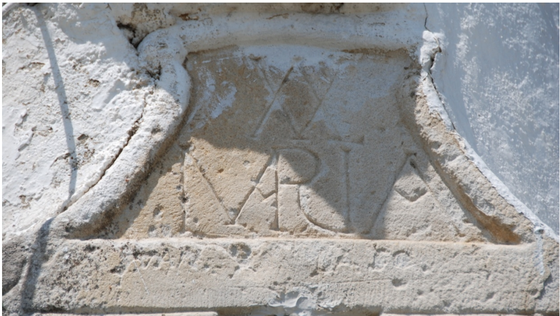
Reloj de sol de Bercedo