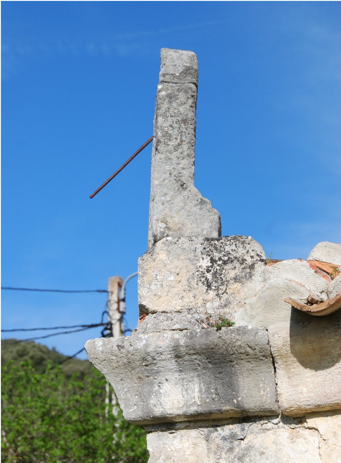
Vista lateral del reloj de sol de Escaño.

La placa de piedra donde se ha grabado el reloj de sol tiene un ensanchamiento en la parte inferior que aumenta la estabilidad del reloj y ajusta en curva con el sillar de la base. sobre el sillar de la base. En la cara lateral se distingue una grieta horizontal como resultado de partirse la placa de piedra en dos.