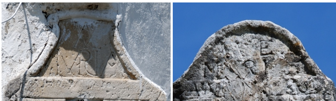
Frontón campaniforme recto y campaniforme curvo. Leyenda AVE MARIA.

Dos tipos de frontón: campaniforme recto (1771-1775) y curvo (1783-1786). El frontón campaniforme recto se utiliza en los cuatro relojes más antiguos: Corconte (1771), San Martín de Porres (1773), Villabáscones de Sotoscueva (1775) y Bercedo (1775); el campaniforme curvo lo llevan todos los relojes restantes: Brizuela (1783), Escaño (1784), Villabáscones de Bezana (1785), Quintanabaldo (1785) y Bezana (1786). La superficie del frontón, excepto en Corconte, está labrada en hueco relieve. Tres de ellos tienen añadida, además, una leyenda escrita en latín. En Corconte, grabada en la base del frontón debajo de la fecha; y en Brizuela y Escaño, en una cartela labrada en hueco relieve en el sillar que sirve de base al reloj.