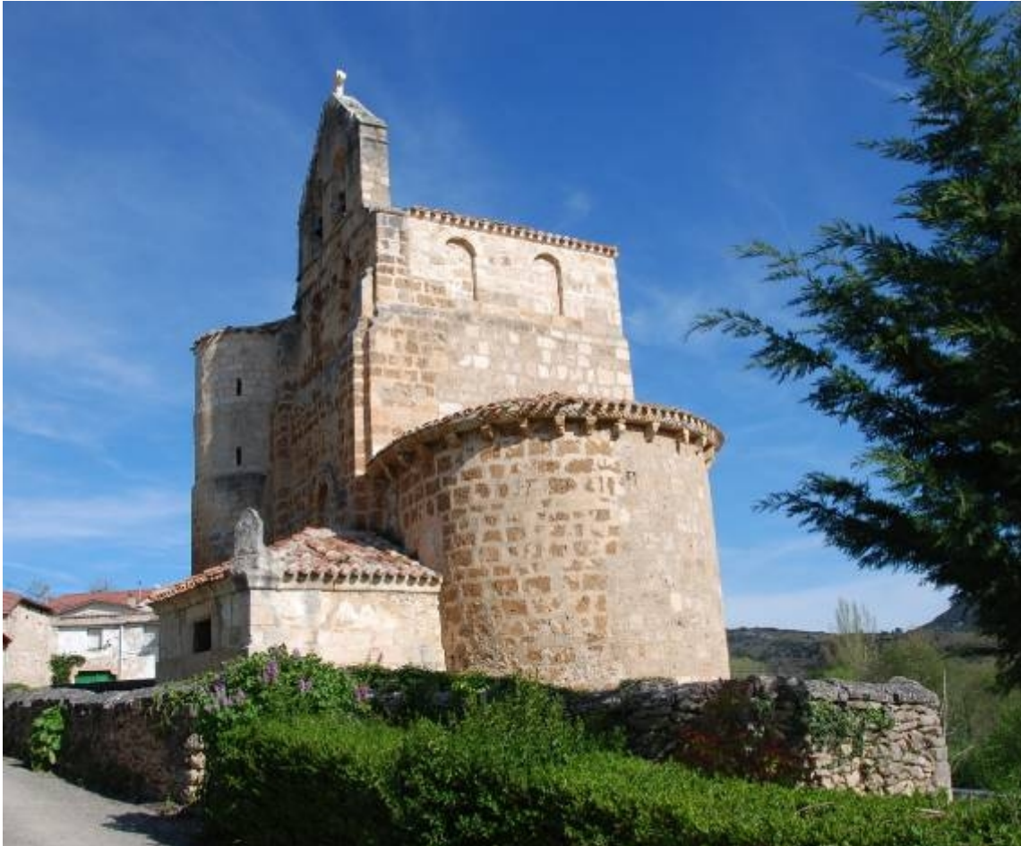
Apoyado sobre la cornisa en la esquina sureste del tejado de la sacristía.

Vertical a mediodía orientado. Año 1784.