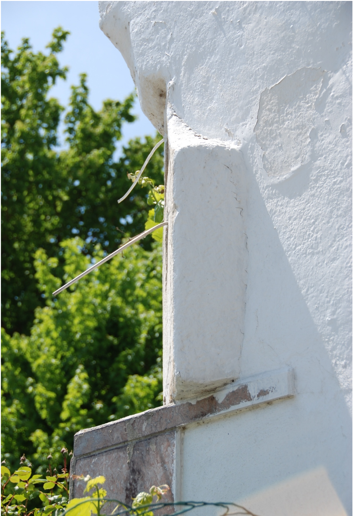
Varilla de un apoyo repuesta.