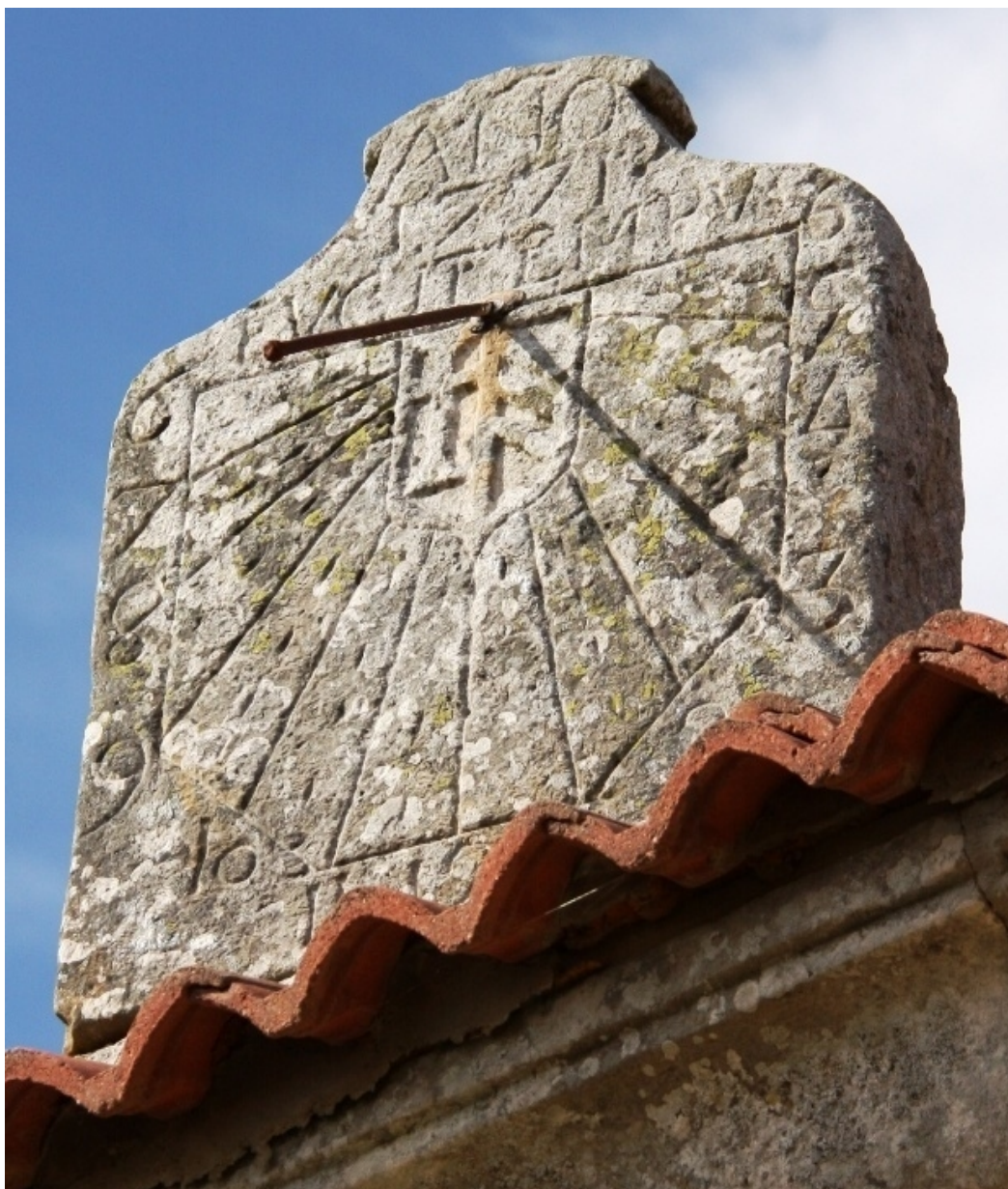
Reloj de sol de la ermita de San Pedro de Corconte. Año 1771.

Es indudable la influencia de los canteros cántabros en la construcción de los relojes de sol del norte de las provincias de Burgos, Palencia y de la zona oeste de Vizcaya (*). En el arciprestazgo de las Merindades de Castilla la Vieja, es especialmente notoria su influencia. El autor del reloj de la ermita de San Pedro, a quien hemos llamado maestro cantero de Corconte - aunque también pudiera tratarse de varios canteros que copiaron el mismo reloj-, trabajó en varias iglesias del norte de la provincia de Burgos. La principal característica que diferencia estos relojes de sol es el escudete distribuidor, ya que lo habitual en las tres provincias citadas es el uso del semicírculo o el círculo como superficie de distribución.