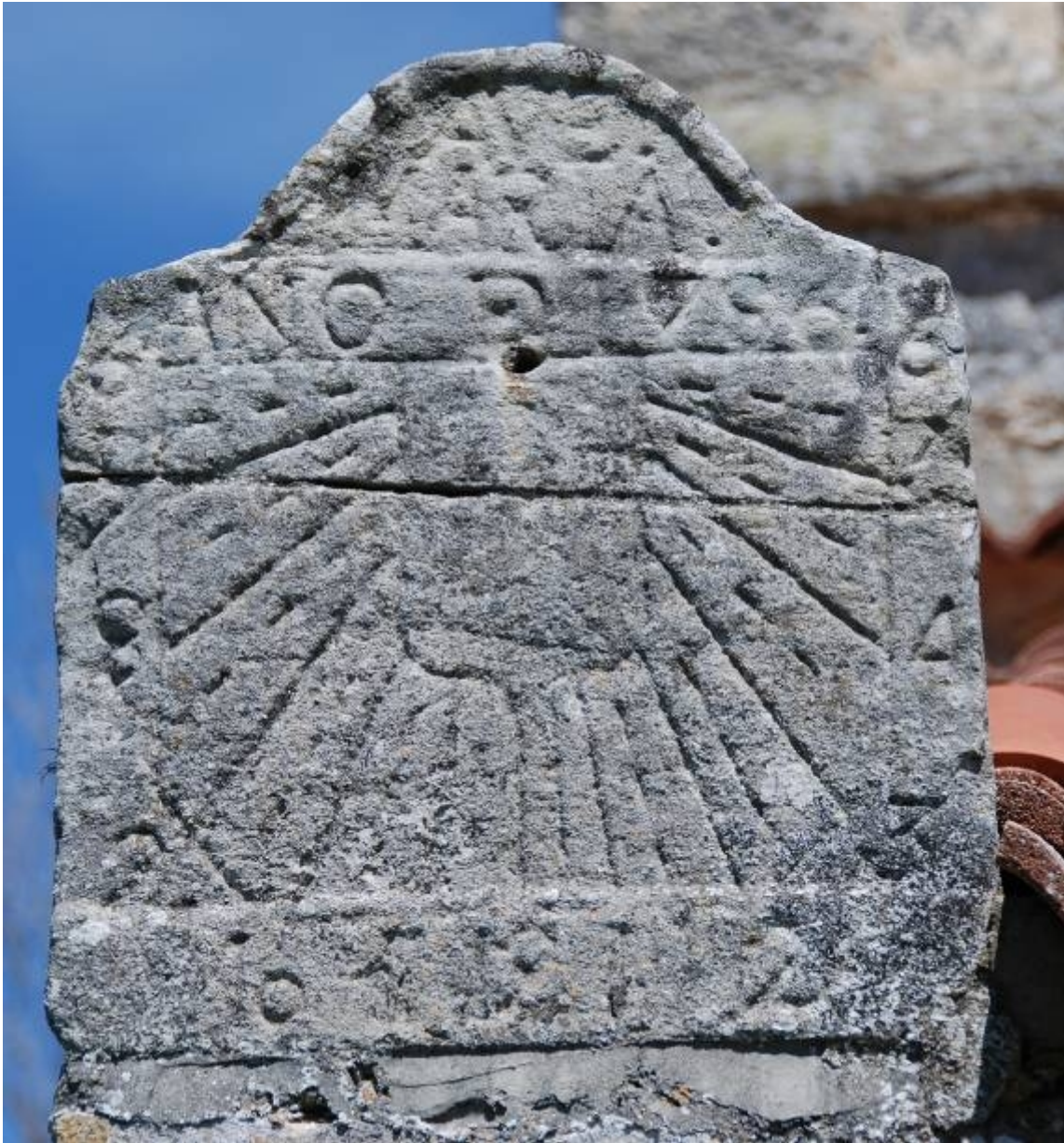
Reloj de sol doble. Cuadrante vertical a mediodía.

Grabado en una placa exenta rematada en frontón campaniforme, apoyada sobre el muro que cierra el pórtico por el oeste.. Marco rectangular simple con las dos esquinas inferiores cortadas a bisel. Escudete distribuidor aparentemente vacío. Horas en números árabigos, de 6 de la mañana a 6 de la tarde. Líneas de medias horas de trazo discontinuo. Varilla de apoyo único desaparecida. Leyenda grabada en el interior del frontón: "AVE MARIA". Fecha bajo el frontón: AÑO DE 1785.