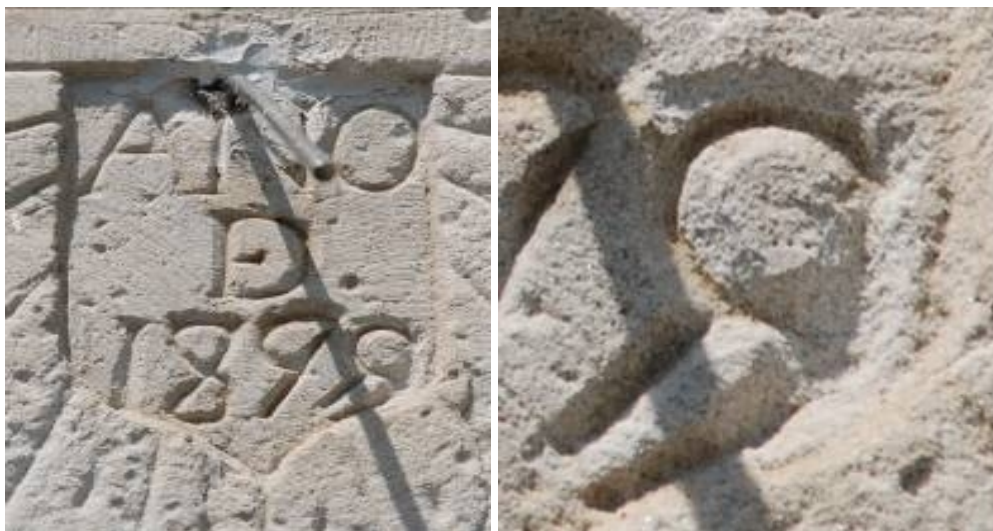
AÑO DE 1899. Fecha alterada.