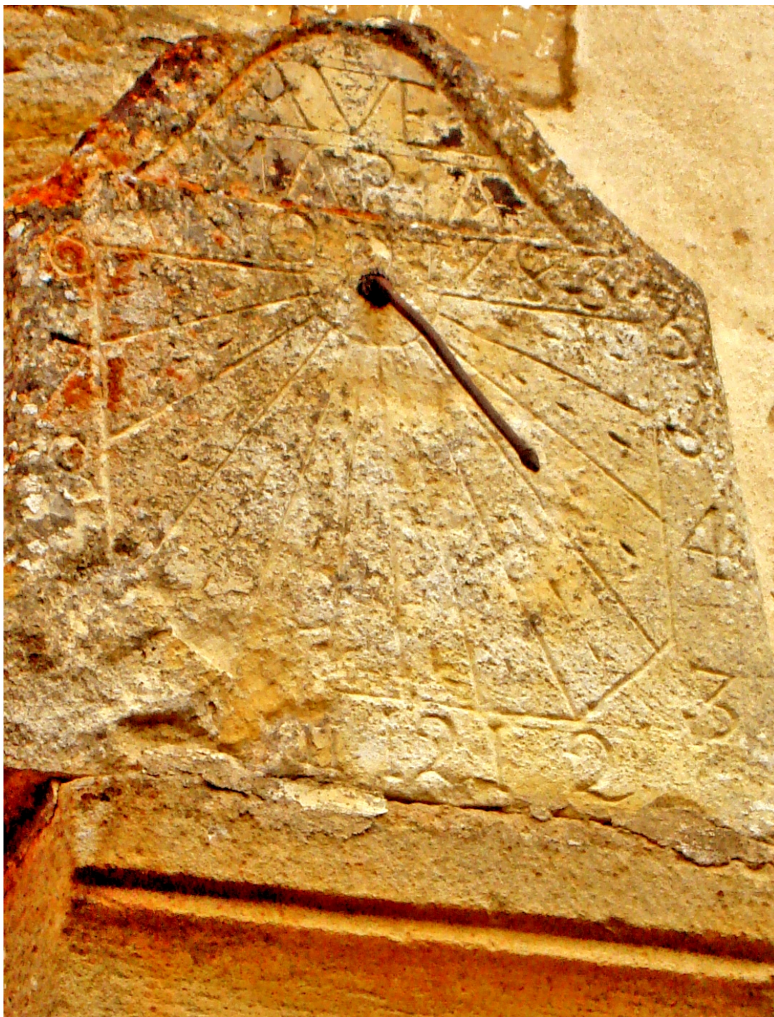
Rectangular horizontal. Vertical a mediodía.

Excepto el escudete distribuidor, el reloj de sol de la iglesia de Cornejo presenta todas las características propias de los relojes del cantero de Corconte. Es el mismo reloj que hemos que se puede ver en las iglesias de Brizuela (1783), Escaño (1784), Villabáscones de Bezana (1785), Quintanabaldo (1785) y Bezana (1786).