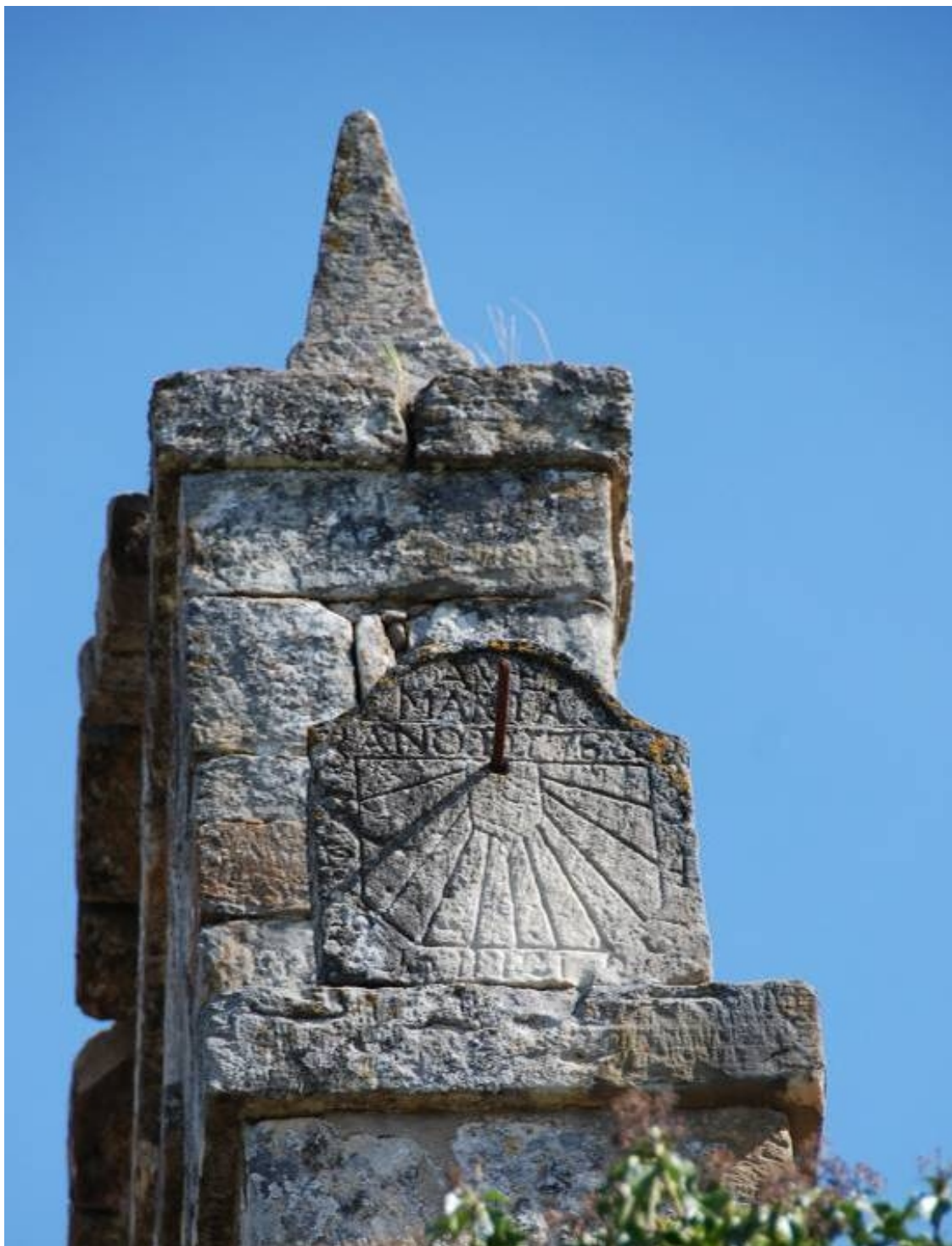
Reloj de sol doble. Cuadrante vertical a mediodía.

Grabado en una placa exenta rematada en frontón campaniforme, apoyada sobre el muro en el costado sur de la espadaña. Marco rectangular simple con las dos esquinas inferiores cortadas a bisel. Escudete distribuidor aparentemente vacío. Horas en números arábigos, de 6 de la mañana a 6 de la tarde. Líneas de medias horas de trazo discontinuo. Varilla de apoyo único en posición horizontal. Leyenda grabada en el interior del frontón: "AVE MARIA". Fecha bajo el frontón: AÑO DE 1785.