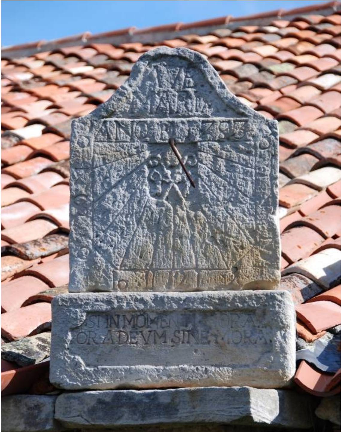
Vertical a mediodía orientado.

Apoyado sobre la cornisa del tejado sobre el único contrafuerte de la fachada sur. Grabado en una placa exenta rematada en frontón campaniforme y elevado sobre un sillar donde se ha labrado una cartela en hueco relieve con la leyenda AVE MARIA. Marco rectangular simple con las dos esquinas inferiores cortadas a bisel. Escudete distribuidor (mitra, báculos en aspa y dos llaves). Líneas de medias horas de trazo discontinuo. Horas en números arábigos, de 6 de la mañana a 6 de la tarde. Varilla de apoyo único. Fecha bajo el frontón: AÑO DE 1783.