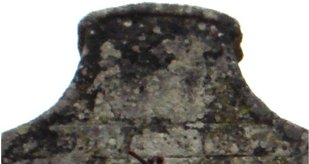
Reloj de sol de Villabáscones de Sotoscueva