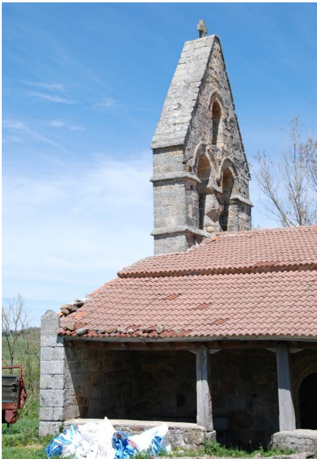
Situado sobre el muro que cierra el pórtico por el oeste. Espadaña románica.

Antigua parroquia de San Vicente. Longitud: - 3,8331 Latitud: 42,9607. Reloj de sol doble: vertical mediodía y vertical a septentrión. Año 1786.