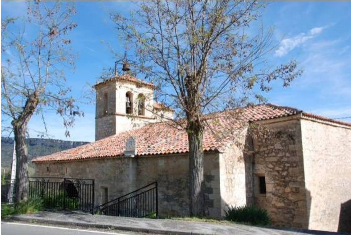
Situado sobre el único contrafuerte de la fachada sur.

San Cristóbal Mártir. Longitud: -3,6675 Latitud: 42,9668. Rectangular horizontal con las esquinas inferiores cortadas a bisel. Vertical a mediodía orientado. Año 1783.