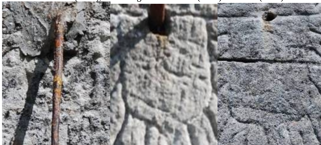
Villabáscones de Bezana (1785) - Quintanabaldo (1785) – Bezana (1786).

Hay otro reloj de sol del siglo XVIII con escudete en la iglesia de La Riva, pueblo cercano a Corconte, que no presenta ninguna de las características de clasificación enumeradas, si exceptuamos que está grabado en un sillar exento pero carente de frontón. En Cantabria el escudete distribuidor perdura en contados casos hasta mediados del siglo XIX.