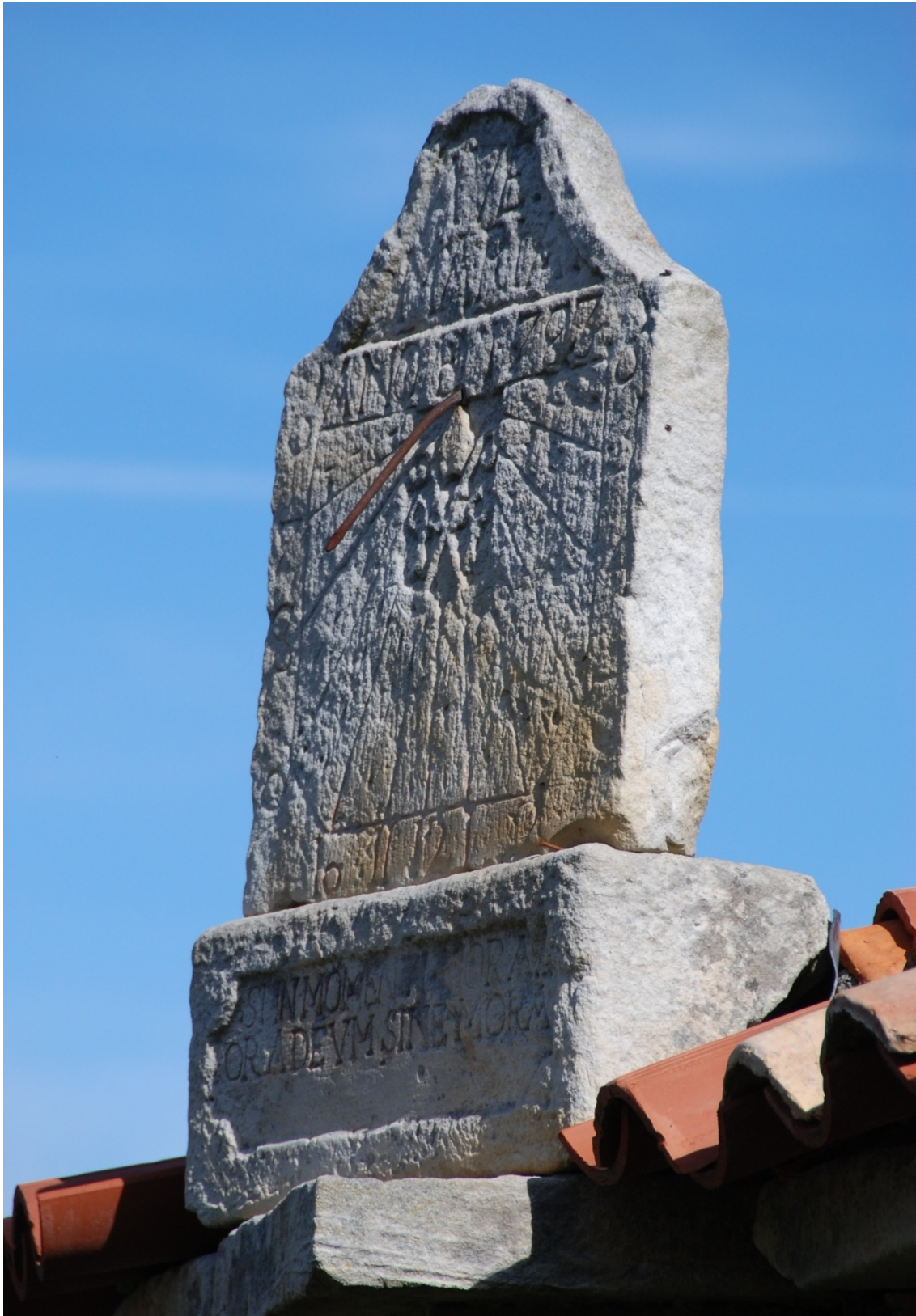
Vista lateral del reloj de sol de la iglesia de Brizuela.

. El reloj de sol de la iglesia de Brizuela, visto lateralmente, aparenta falta de equilibrio. Quizás por esta razón, la placa de piedra del reloj de Escaño, construido dos años después, tiene un ensanchamiento en la base que mejora la estabilidad.