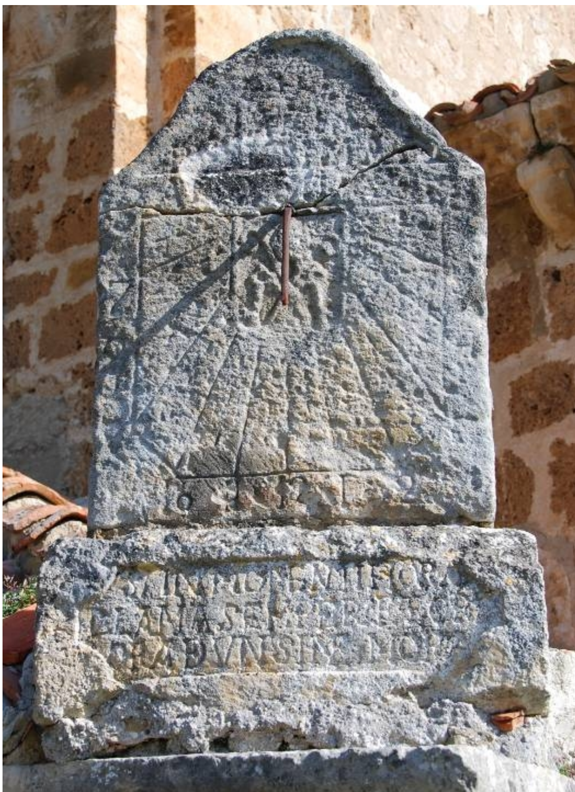
Vertical a mediodía orientado.