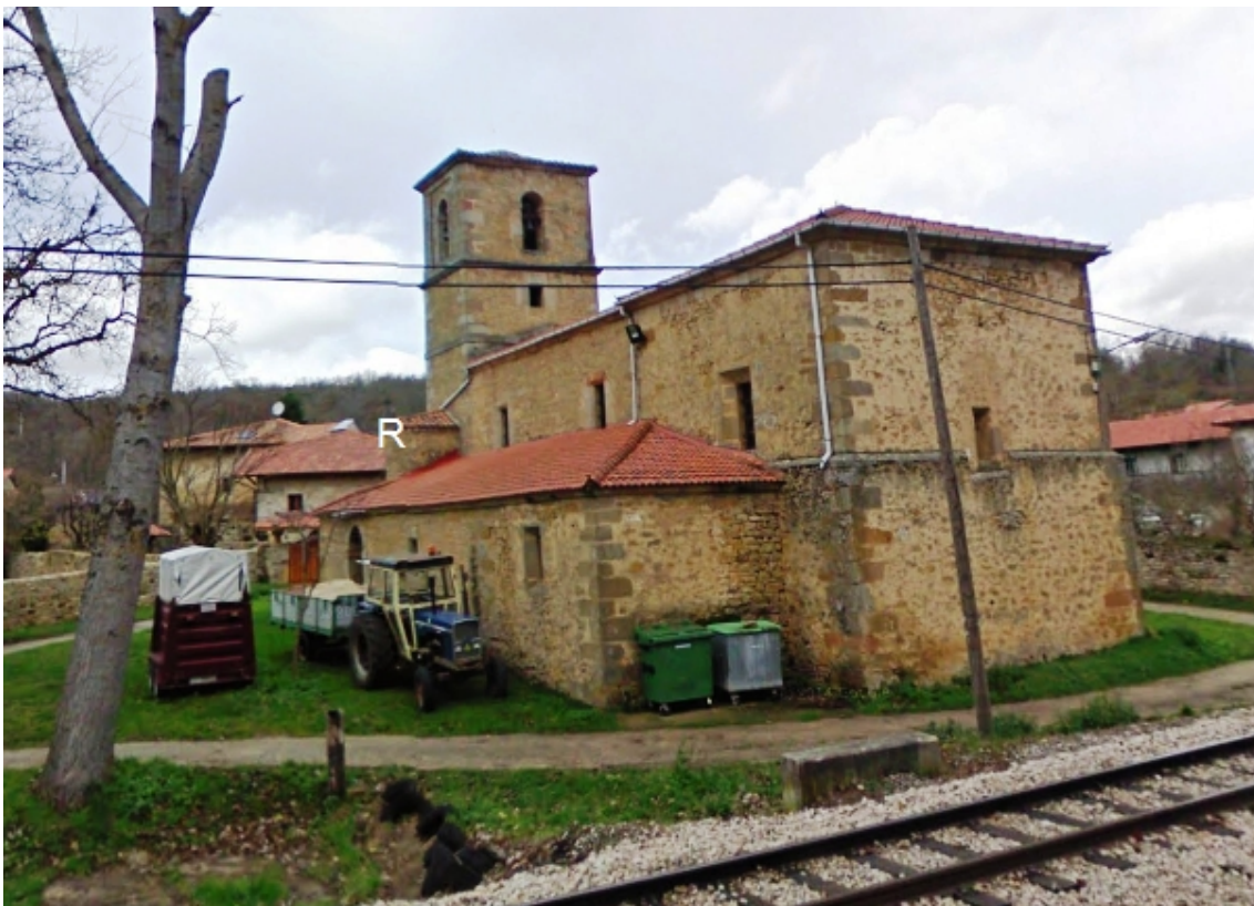
Reloj de sol grabado en un sillar exento apoyado en la cubierta del husillo.