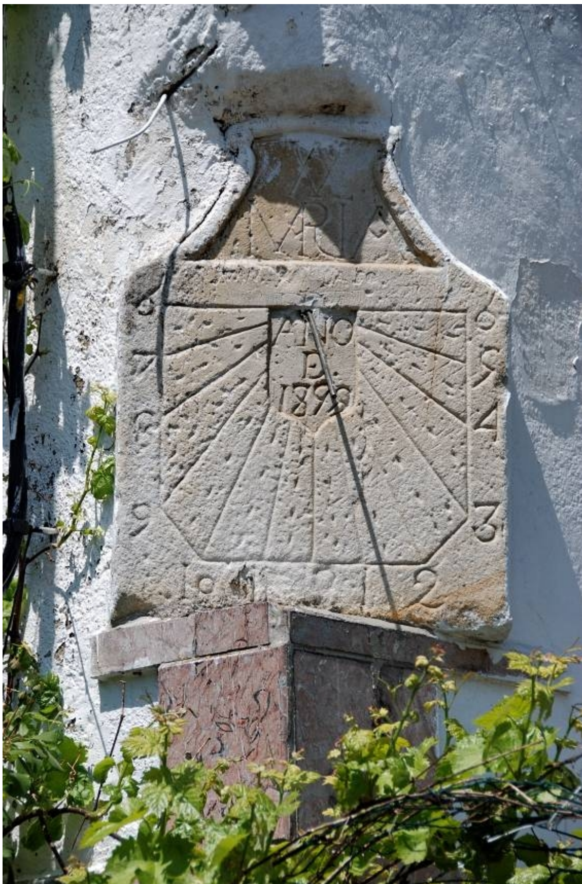
Rectangular horizontal con las esquinas inferiores cortadas a bisel. VMO.