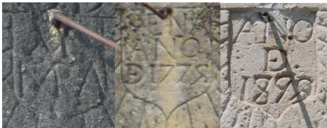
San Martín de Porres (1773)-Villabáscos de Sotoscueva (1775)- Bercedo (1899)

Si algo caracteriza a este conjunto de relojes de sol es el pequeño escudete distribuidor. En el reloj de la iglesia de Corconte (1771) el escudo es partido y lleva una cruz y tres barras en diagonal; la mitra, dos báculos colocados en aspa y dos llaves decoran los relojes de Brizuela (1783) y Escaño (1784); la leyenda AVE MARIA abreviada ocupa por completo en el de San Martín de Porres (1773), en los de Bercedo (1775) y Villabáscos de Sotoscueva (1775) se ha grabado la fecha, y los escudetes de los tres relojes restantes – Villabáscos de Bezana (1785), Quintanabaldo (1785), y Bezana (1786) - parecen vacíos.