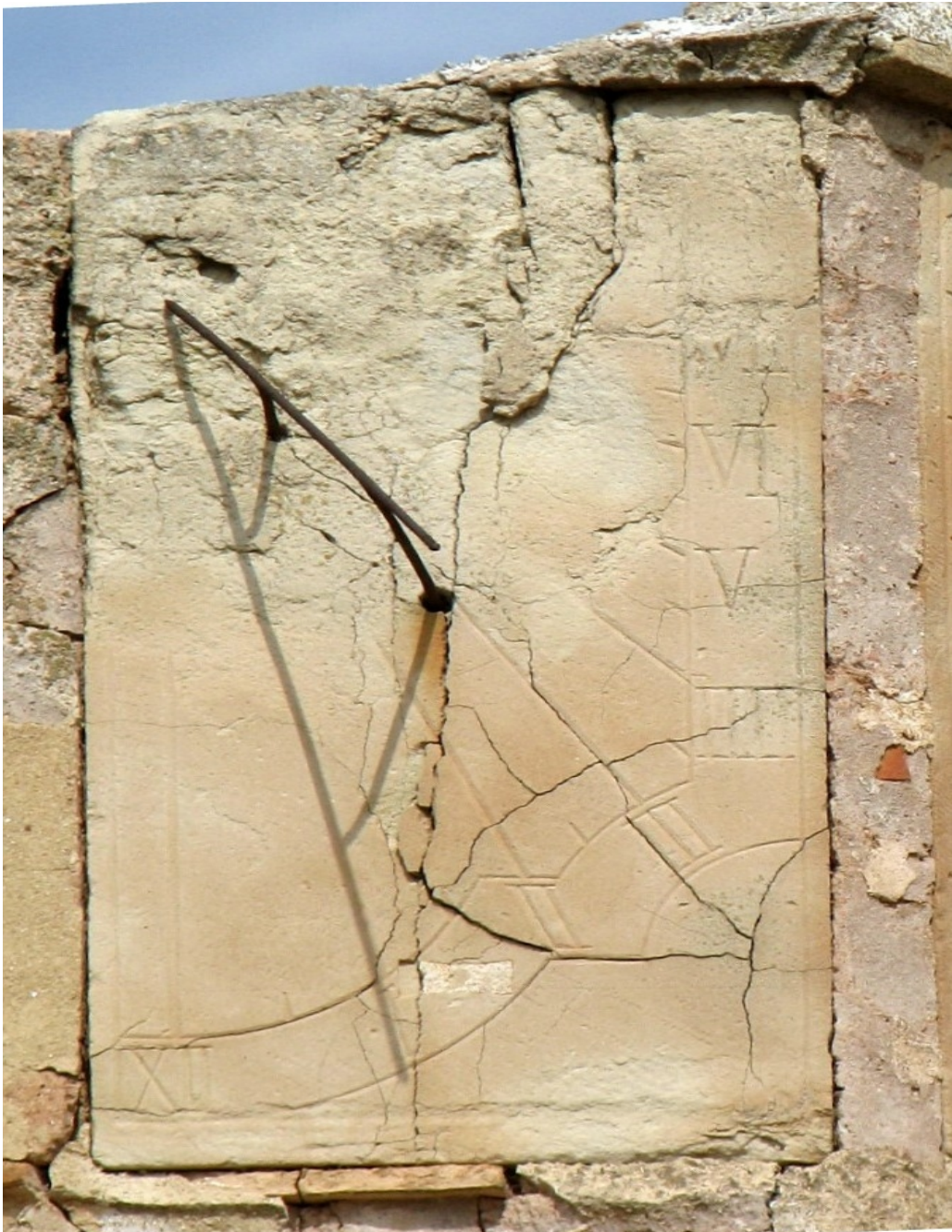
Reloj doble orientado. Cuadrante vertical a poniente.