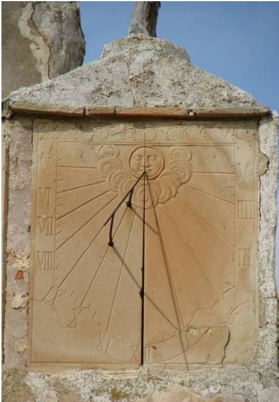
Reloj doble orientado. Cuadrante vertical a levante.

El declinante a poniente está formado por dos placas de barro cocido; el vertical a poniente, mal conservado, solo por una.. Los dos cuadrantes están numerados en romanos. El declinante a levante marca de V de la mañana a V de la tarde; el declinante a poniente, de XII de la mañana a VII de la tarde. Los dos tiene grabadas líneas cortas de medias horas y cuartos. La decoración, como se ha dicho más arriba, se repite en todos sus cuadrantes: un sol saliendo de las nubes como círculo distribuidor, y utiliza bordes mixtilíneos ornamentales en el borde inferior del marco. El modelo de varilla es el mismo en todos sus relojes.