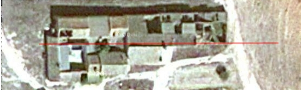
Los Cerrillares. Finca Casa Serrano. El edificio está orientado al sur.