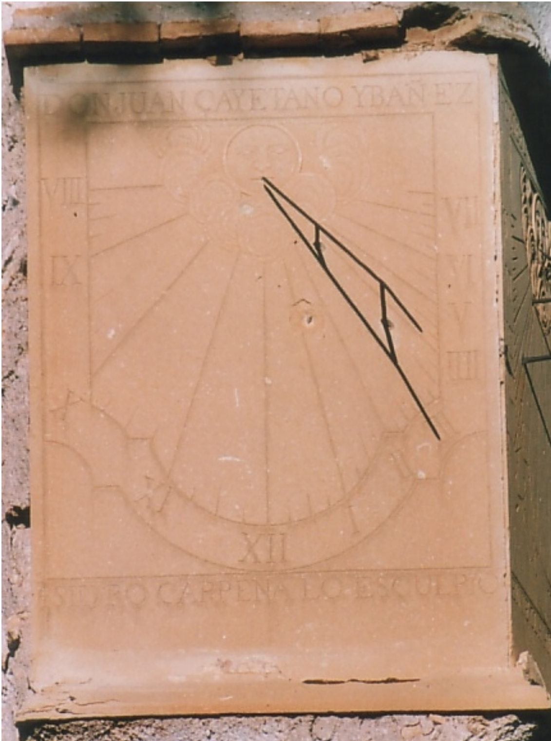
Reloj doble orientado. Cuadrante vertical declinante a poniente.

Numeración romana de VIII de la mañana a VII de la tarde. Varilla de perfil circular de doble apoyo que no llega a tocar el polo. Inscripción superior: DON JUAN CAYETANO YBAÑEZ. Inscripción inferior: ISIDRO CARPENA LO ESCULPIÓ. Sol humanizado saliendo de las nubes decorando el polo.