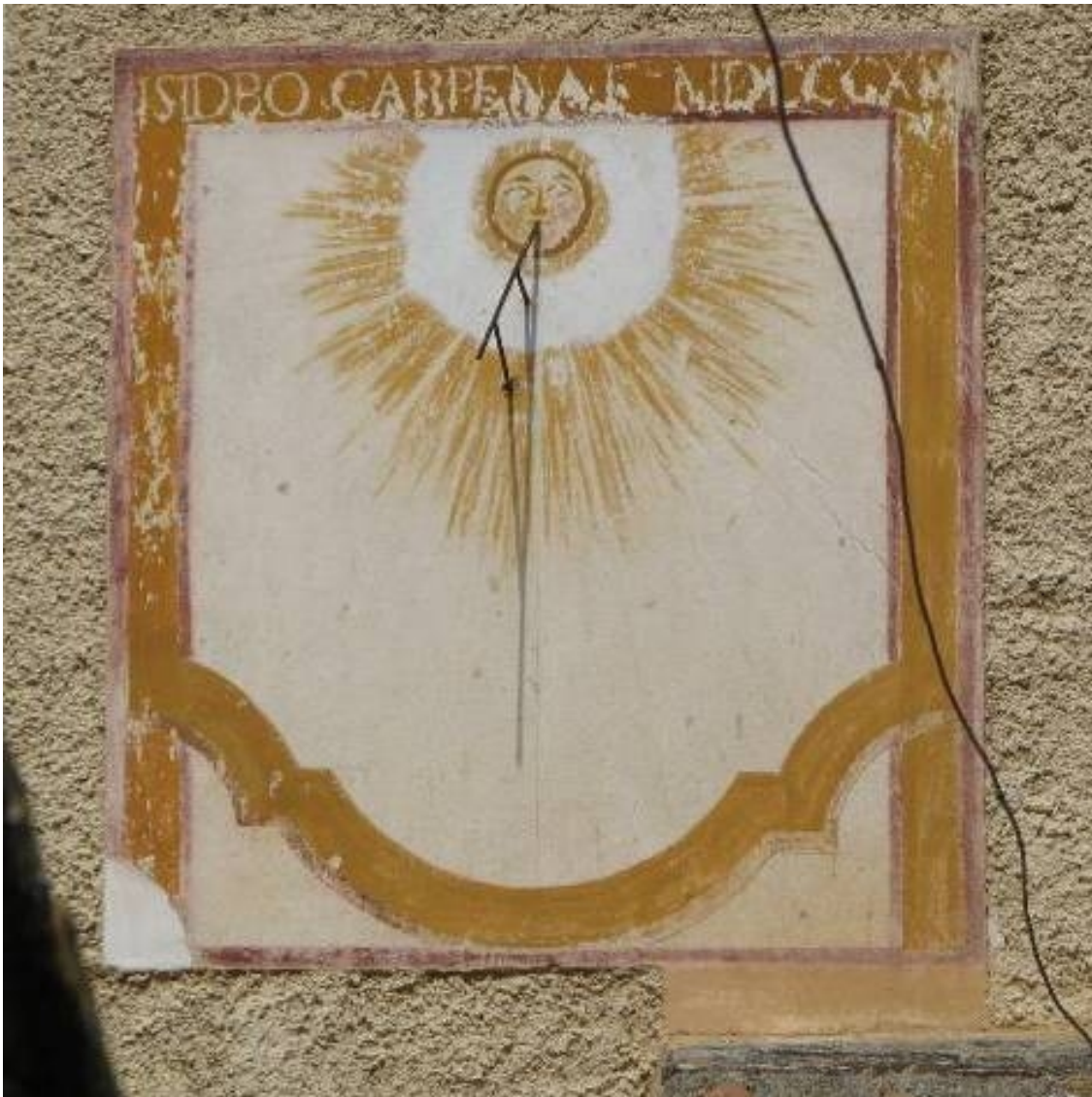
Vertical declinante a levante.

La Sierra de Santa Ana está situada a 6 km al sur de Jumilla. En pleno corazón de la sierra, junto al manantial de la Fuente de la Jarra, se encuentra Convento franciscano de Santa Ana del Monte. Se fundó en 1573 a partir de una pequeña ermita del siglo XV dedicada a Santa Ana. El conjunto de edificios del convento es barroca de los siglos XVII-XVIII. La fachada se reconstruyó en 1902.