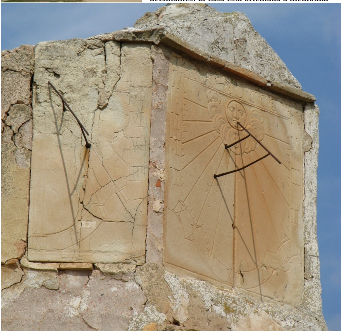
Reloj doble orientado. vertical declinante a levante y vertical declinante a poniente.

La “instalación” no hace honor a la calidad del cuadrante, ni justifica el cálculo de dos relojes declinantes: la casa está orientada a mediodía.