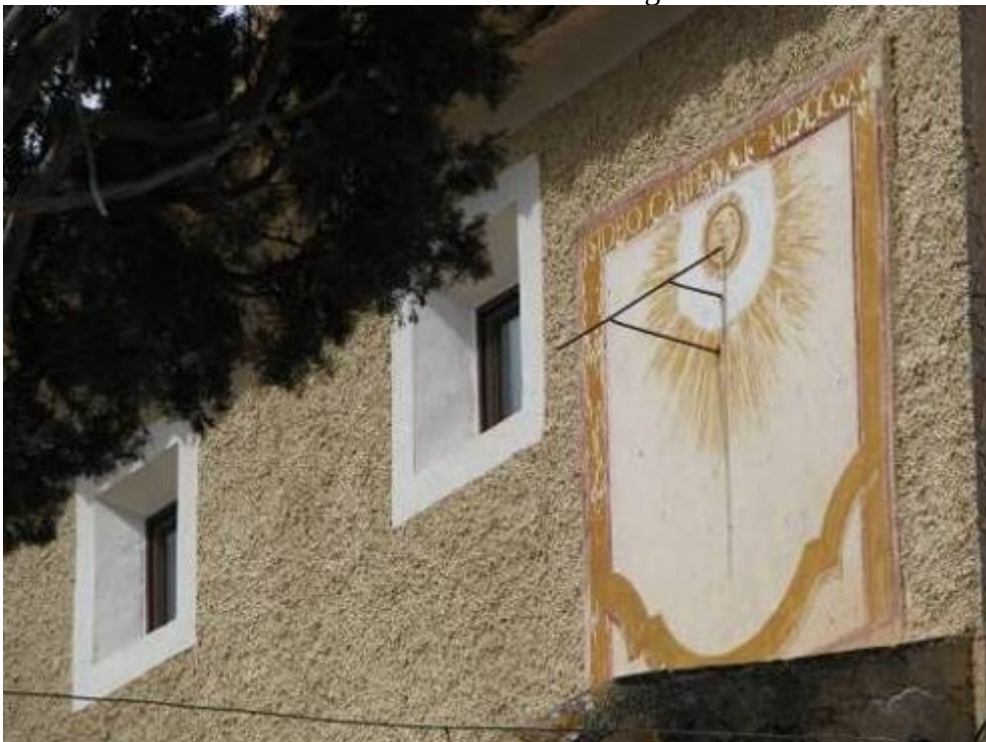
Pintado en una superficie enlucida en la esquina SE del convento.