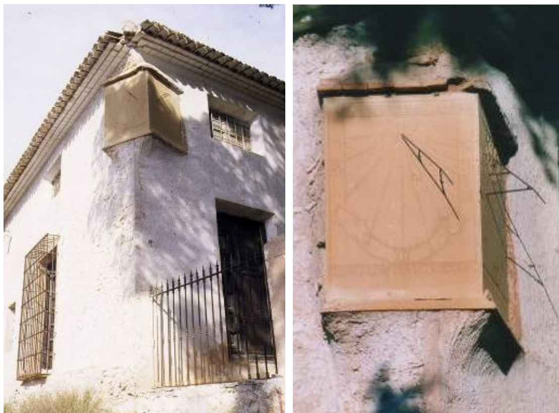
Reloj de sol doble: vertical declinante a levante y vertical declinante a poniente.

Reloj doble: VDL y VDP. Inscripción superior: DON JUAN CAYETANO YBAÑEZ / POSSEEDOR DE ESTE VINCULO. Inscripción inferior: ISIDRO CARPENA LO ESCULPIO / EN YECLA AÑO MDCCCIV.