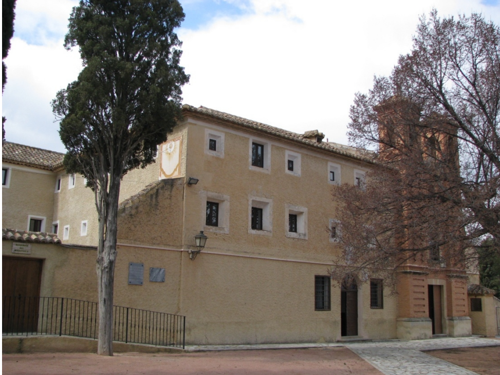
Fachada este del convento. Las dos torres gemelas de ladrillo.

Convento franciscano de Santa Ana del Monte. Longitud: -1,31 Latitud: 38,42. Rectangular vertical con el borde inferior en moldura. VDL. Año MDCCCXII. Autor: Isidro Carpena.