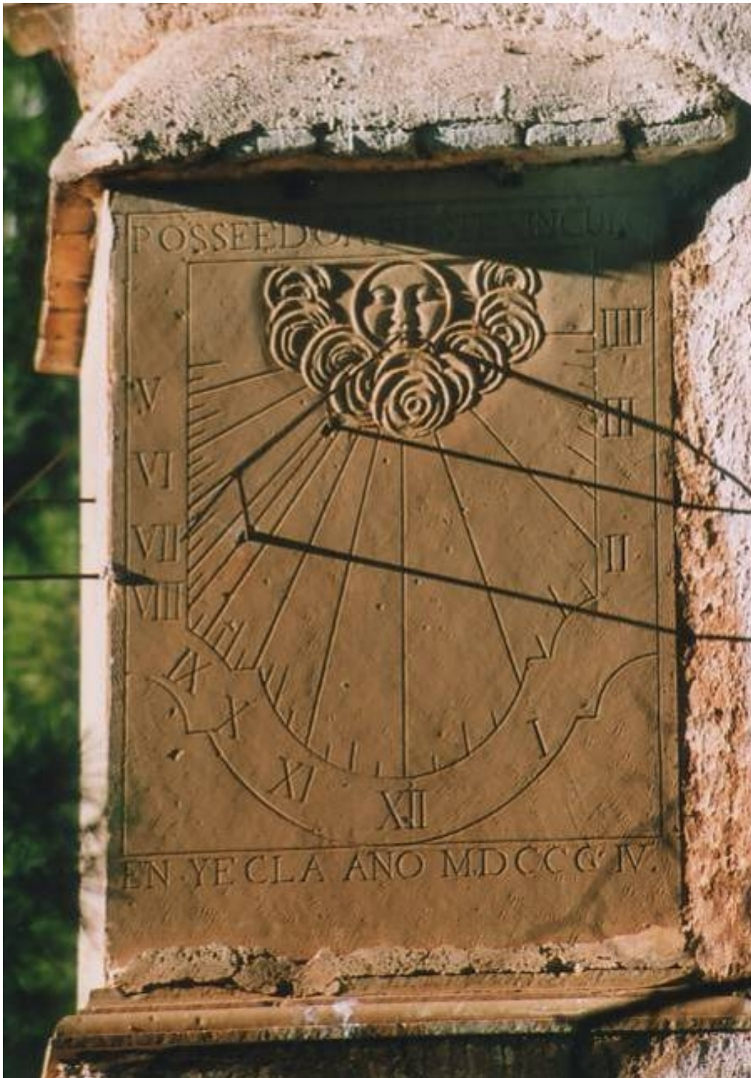
Reloj doble orientado. Cuadrante vertical declinante a levante.

Reloj 2. Numeración romana de V (marca desde las cuatro y media) de la mañana a III de la tarde. Líneas de medias horas y de cuartos de hora. Varilla de perfil circular de doble apoyo que no llega a tocar el polo. Inscripción superior: POSSEEDOR DE ESTE VINCULO. Inscripción inferior: EN YECLA AÑO MDCCCIV. Sol humanizado asomando por encima de las nubes decorando el polo.