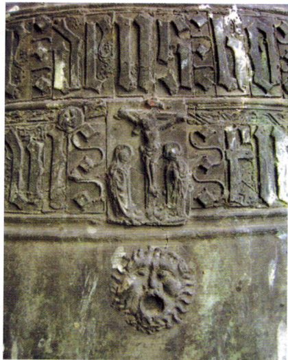
La Mònica, campana dels quarts de la Seu Vella de Lleida. Va ser fosa el 1486 per Nicolau Barrot. Detall de la rica epigrafia i decoració. Hi destaca el Calvari central.

Naturalment, la Seu Vella és un exemple que marca una manera de fer actual, sobre la qual tornarem. Nosaltres proposem, com ja ho hem fet en altres àmbits, que les campanes del rellotge, restaurades, i sobretot la Mònica , soldada, pengin d'una estructura de fusta ele-