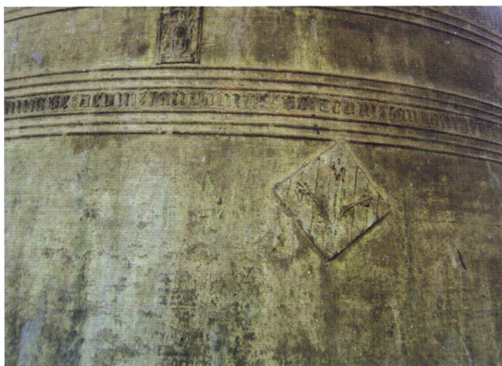
La Silvestra, campana de les hores de la Seu Vella de Lleida. Va ser fosa el 1418 per Joan Madam o Adam. Detall de l'epigrafia i decoració; hi veiem l'escut de Lleida.

El pecat no acaba aquí. Hem esmentat la secular separació de les campanes de rellotges, l'ús de les quals és considerat pertanyent a l'àmbit civil, és a dir municipal, i d'ús litúrgic. De fet, aquesta pertinença municipal, real o suposada, fou el motiu pel qual les campanes del rellotge foren "salvades" durant la guerra i que no figurin en els tocs de les altres, amb poques excepcions, estrictament locals, com el toc de la Beneta o Bombo de Girona, a batallades, o de la Petra Clàudia de Reus, brandada, per a les festes. La campana de les hores de la Seu Vella, la Silvestra , no fou mai brandada, fins a la mecanització.