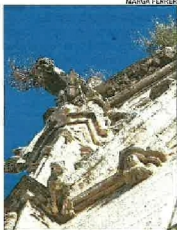
Las gárgolas del Micalet.

■ El Círculo por la Defensa del Patrimonio Cultural ha denunciado que arbustos y matojos colonizan los principales monumentos de Valencia, como las gárgolas góticas del Micalet 15 y editorial