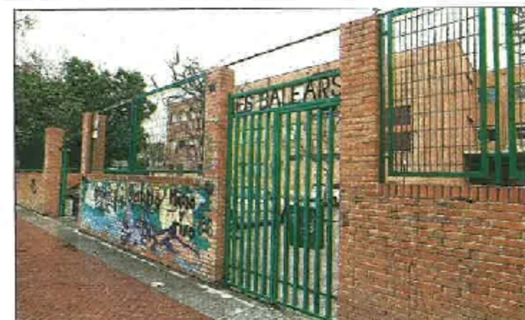
Fachada con pintadas del IES Balears.