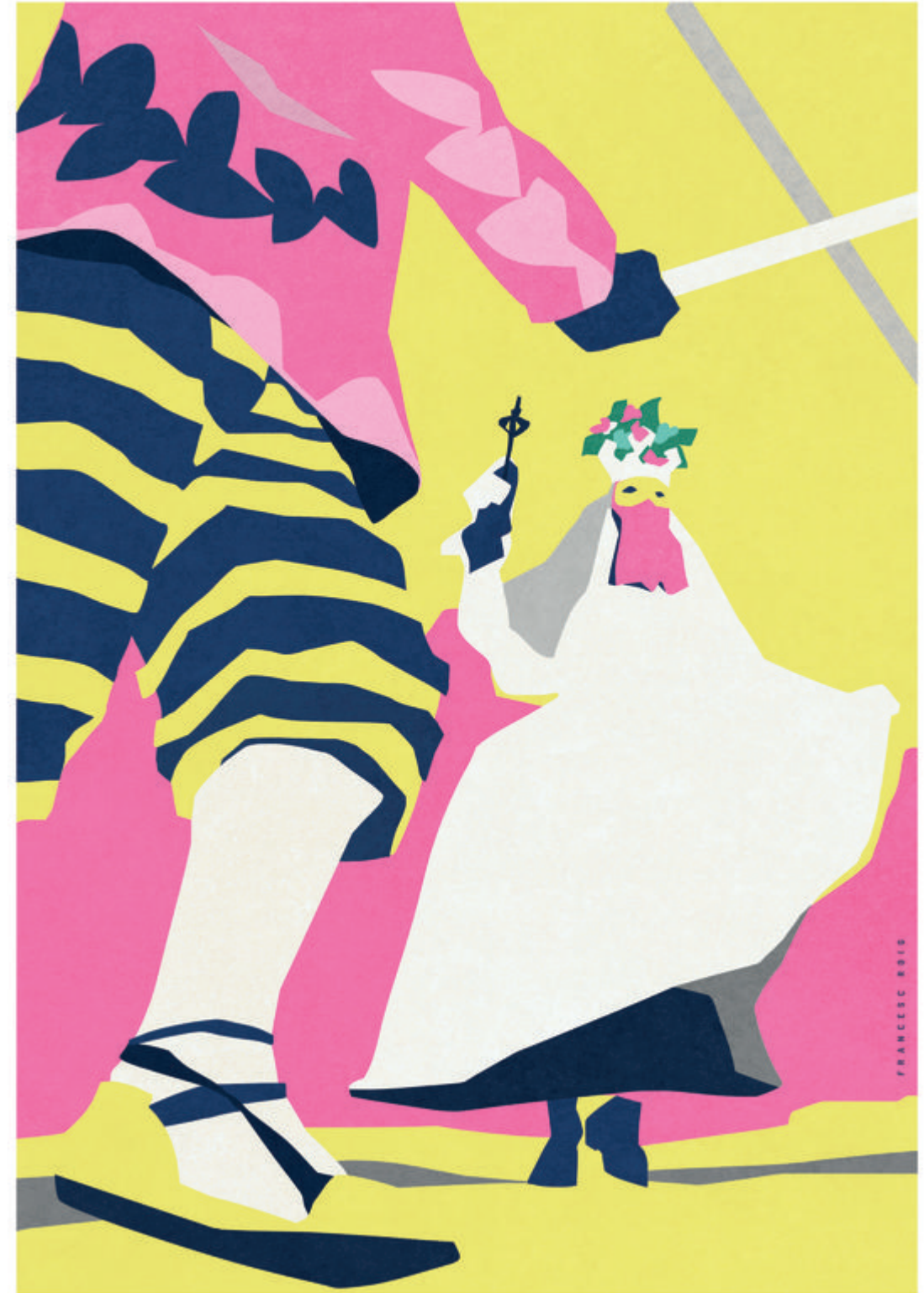
Il·lustració: Francesc Roig

D'altra banda, la celebració del Corpus Christi a València varia cada any, entre el 21 de maig i el 24 de juny, sempre depenent del calendari litúrgic —seixanta dies després de la segona pasqua— i partint de l'any en què la primera processó va ser instaurada pel bisbe Hug de Fenollet: 1355. Al llarg dels segles ha patit modificacions, però en l'actualitat té la vitalitat i l'esplendor que li correspon, amb l'empenta laboriosa de l'Associació dels Amics del Corpus de la Ciutat de València i amb una transcendència que va molt més enllà de l'estricta religiositat. En l'aspecte lingüístic, per exemple, hi ha la dita saludar més gent que el capellà de les roques , en una referència a les nombroses salutacions que feia el mencionat capellà mentre anunciava una festa declarada bé d'interés cultural des de l'any 2005. Actes multitudinaris. La Cavalcada del Convit i la Processó General són d'una solemnitat esborronadora, amb un missatge d'elevat contingut pedagògic. Només cal veure, en aquest sentit, la dansa de la Moma, potser la més famosa, que balla a colp de bastó contra els set pecats capitals, els Momos. S'ha de veure, certament, ja que segons s'afirma és “una narració espectacular del relat mític cristià, amb referències a passatges de l'Antic Testament i també a personatges lligats a tradicions locals”. En conjunt, una delícia per als sentits.