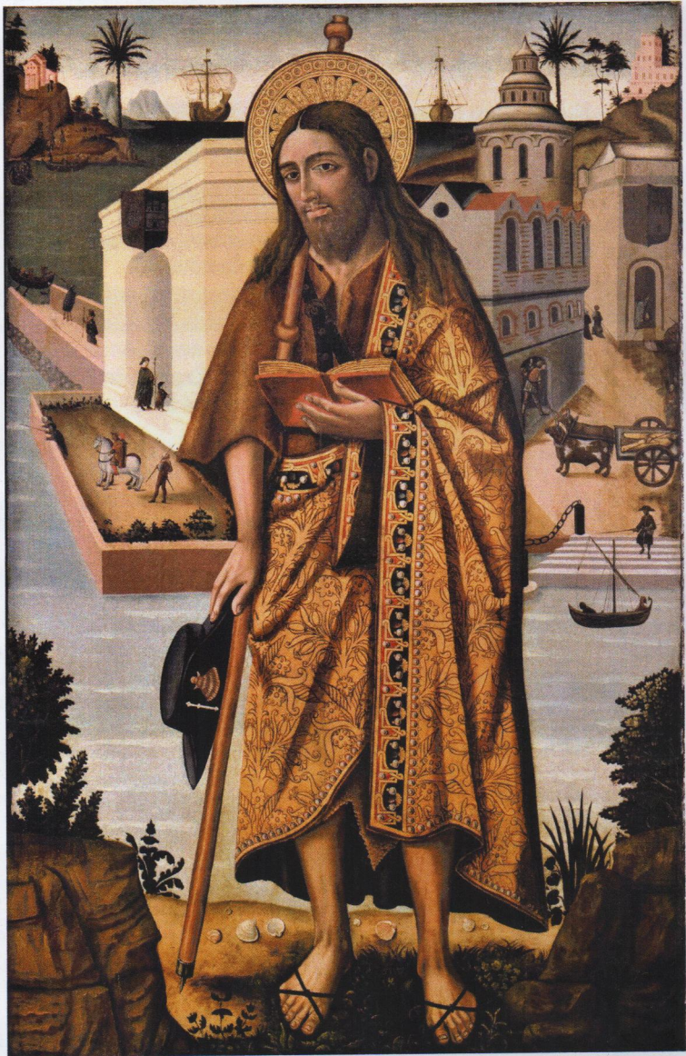
Maestro de Perera. San Jaime, Fines s. XV. Catedral de Valencia, Museo