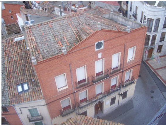
ayuntamiento visto desde la torre de santa María de Mediavilla