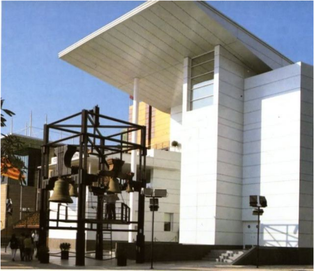
Pavelló de la Comunitat Valenciana (1992)

El punt d'inflexió dels tocs manuals de campanes fou el Pavelló de la Comunitat Valenciana de l'Expo de Sevilla, on estaven exposades sis campanes gòtiques, amb la certesa que el seu so és el mateix que ja sonava abans de 1492. Van participar uns 60 campaners valencians, al llarg dels sis mesos de l'exposició universal, tocant quatre vegades al dia. Va significar un canvi de percepció radial: ja no érem campaners endarrerits - en el meu poble ja van elèctriques sinó artistes: quan feu el pròxim concert?