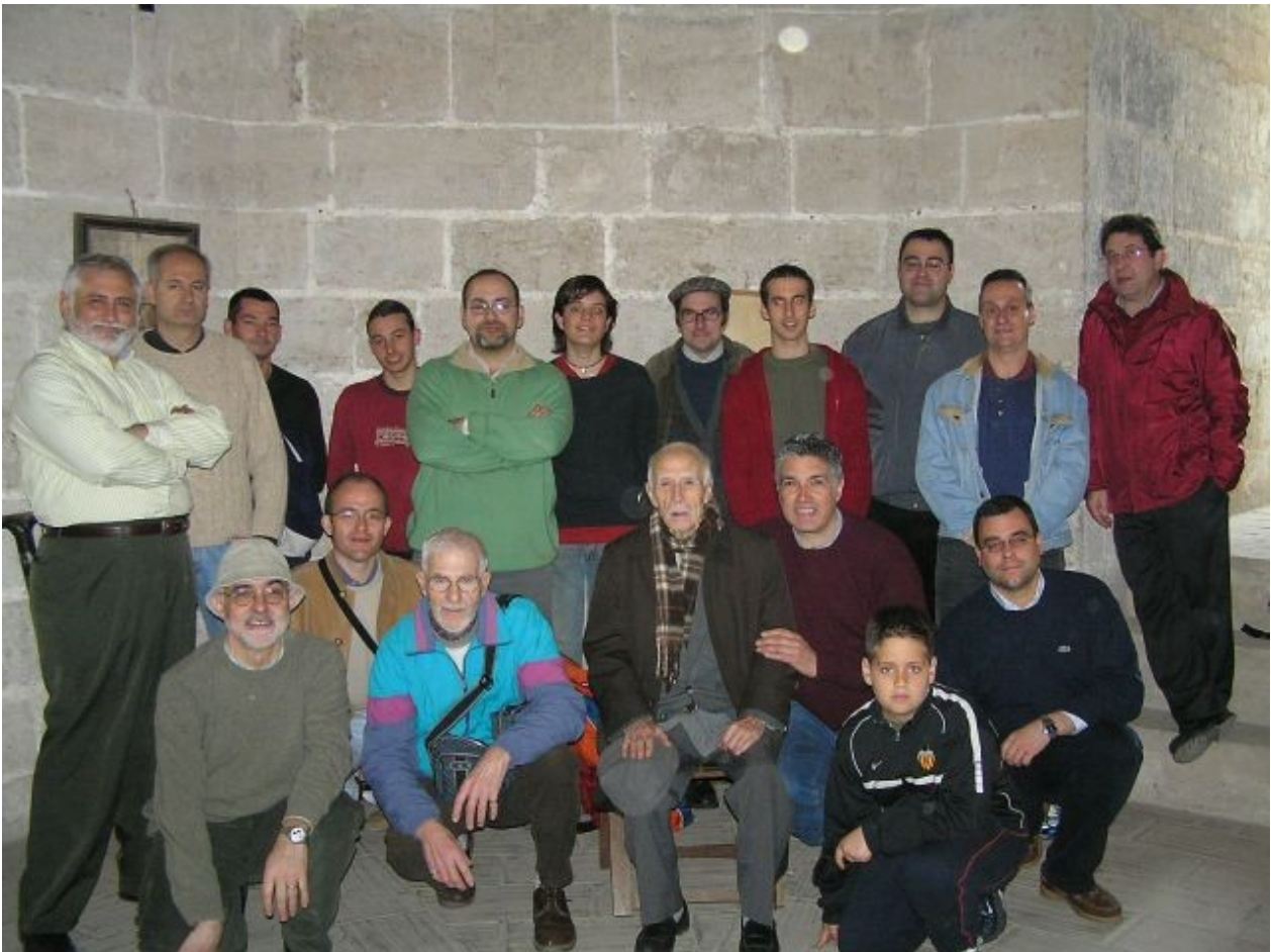
Junta fundacional dels Campaners de la Catedral de València (04-04-2005)

La proliferació de grups de campaners en diverses poblacions valencianes va motivar la creació dels Campaners de la Catedral de València en 2005, com a resposta a la nova manera de tocar campanes, després de la restauració de múltiples campanars valencians. Un dels motius era purament administratiu: els ajuntaments només podien subvencionar associacions locals. Després de diversos intents, la creació d'una Federació Valenciana de Campaners no ha acabat de quallar.