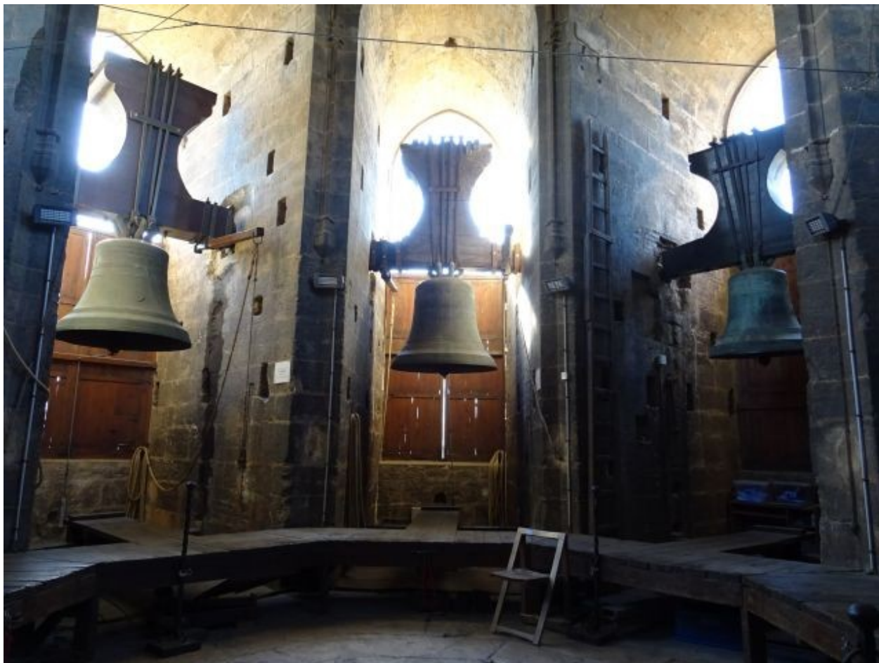
La sala de campanes (01-12-2017)

instal·lacions que sonin com a l'inici, és la garantia que es tracta d'una restauració i no pas d'una nova substitució.