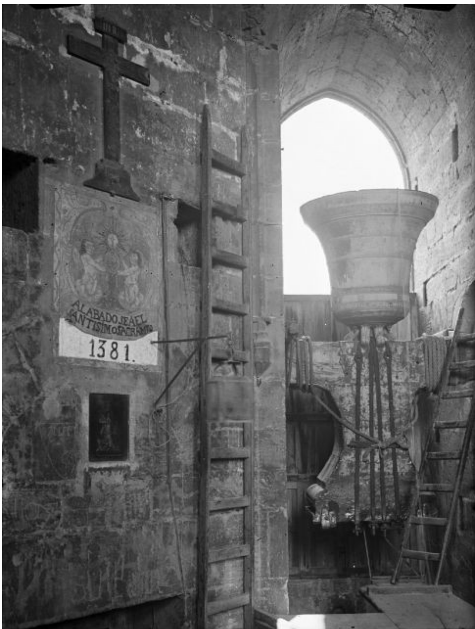
WÜNDERLICH, Otto - Vista de la sala de campanes (1930ca)

Els tocs de campanes de la Catedral de València seguien regles molt complexes, segons la Consueta de la Catedral, de la qual es conserven diversos exemplars, amb lleugers canvis al llarg dels segles. Hi havia més de dos-cents, adaptats a la complexitat de la vida litúrgica de la seu, però també a la vida urbana, El toc d'alba, que sonava en el mateix moment que sortia el sol, durava uns quants minuts, suficients per a servir de despertador de la ciutat. Els diversos tocs de cor no sols anunciaven els rituals catedralicis (laudes, missa conventual, vespres...) sinó anaven marcant trams