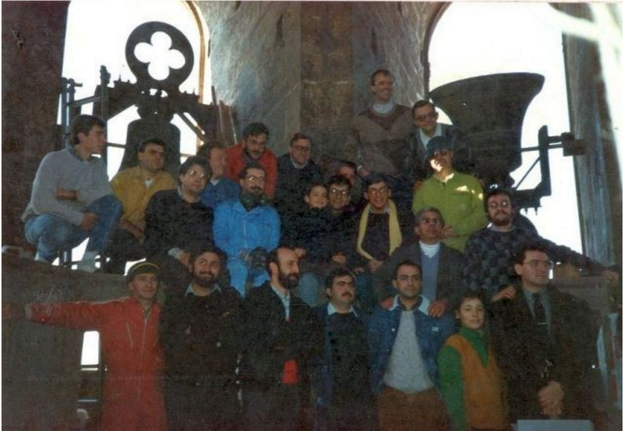
Junta fundacional del "Gremi de Campaners Valencians" (22-01-1989)

En 1989, junt als Amigos de las Campanas de Segorbe es va crear el Gremi de Campaners Valencians en la Catedral de València, que volia unir en una sola associació les persones relacionades amb les campanes, els tocs i els campaners valencians. En els primers anys el Gremi tenia més de 200 associats, de tots els grups actius aleshores.