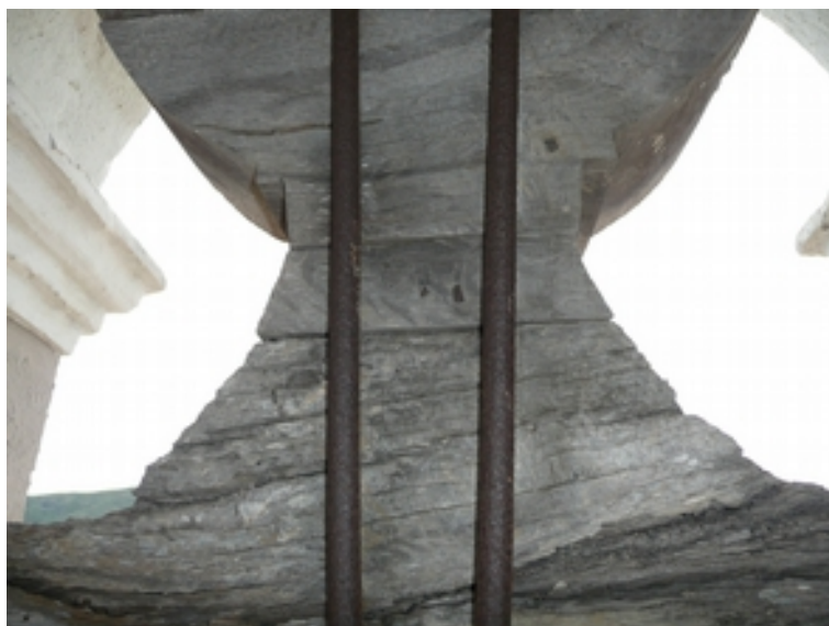
DETALLE ESTADO PÉSIMO DE CONSERVACIÓN DEL YUGO DE MADERA