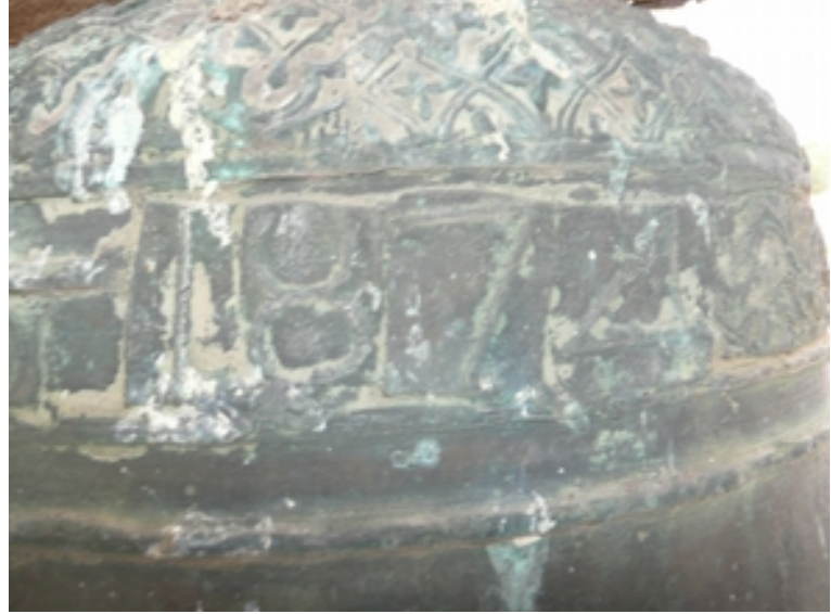
Detalle del año de la campana "1874"