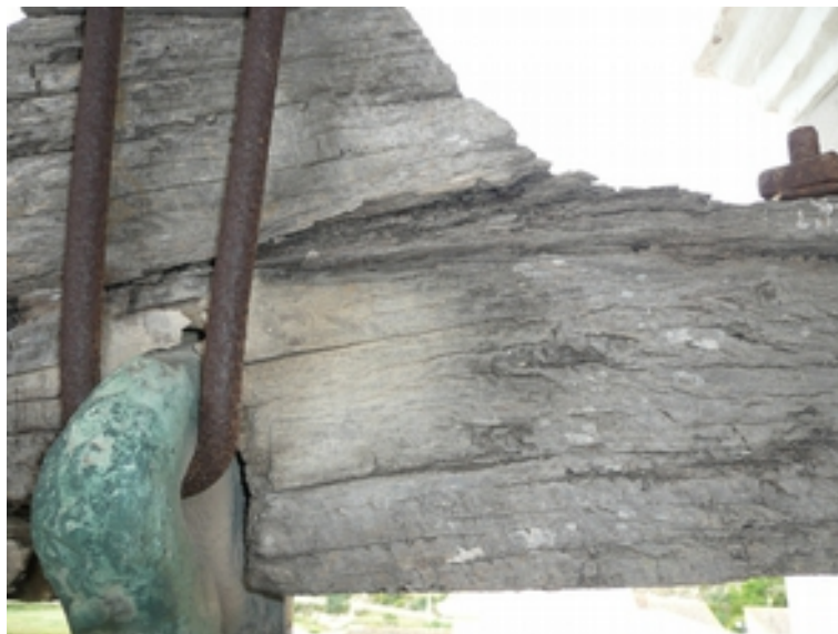
DETALLES DEL DETERIORO Y PUTREFACCIÓN DE LA MADERA DEL YUGO