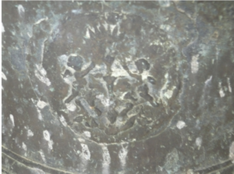
DETALLE INSCRIPCIONES Y RELIEVES DE LA CAMPANA