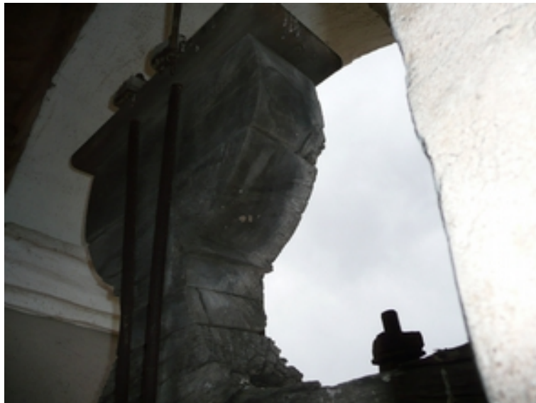
DETALLE YUGO ACTUAL DE PERFIL RECTO