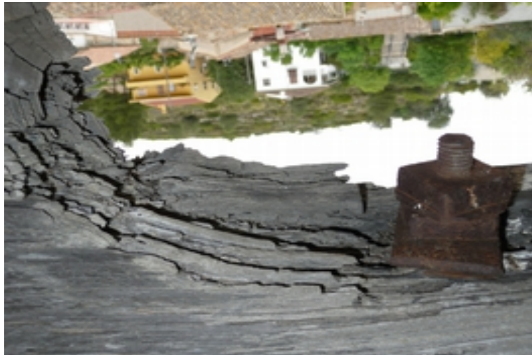
DETALLES DEL DETERIORO Y PUTREFACCIÓN DE LA MADERA DEL YUGO