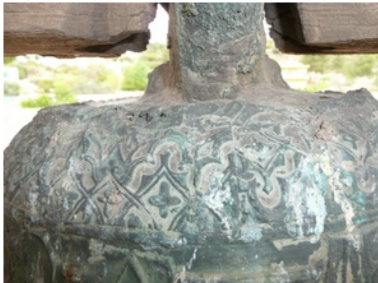
DETALLE ESTADO PÉSIMO DE CONSERVACIÓN DEL YUGO DE MADERA