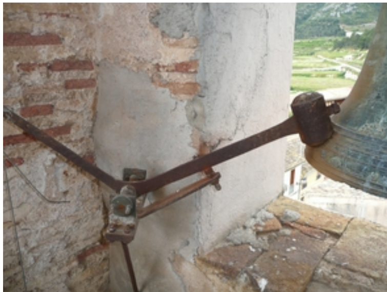
MARTILLO DE CAIDA LIBRE PARA EL TOQUE DE LAS HORAS