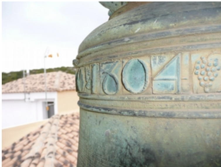
Detalle del año de la campana "1804"