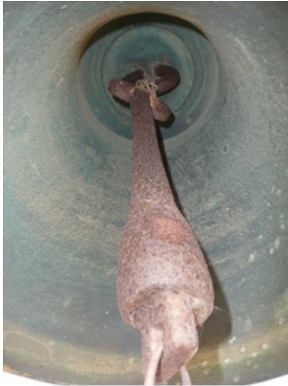
DETALLE BADAJO ACTUAL DE LA CAMPANA Y SUJECCIÓN DEL MISMO