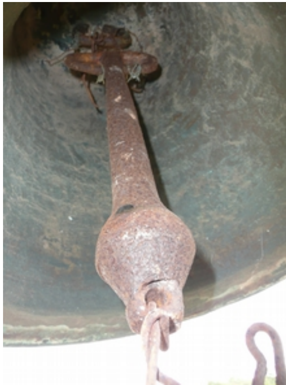
DETALLE BADAJO ACTUAL DE LA CAMPANA Y SUJECIÓN DEL MISMO