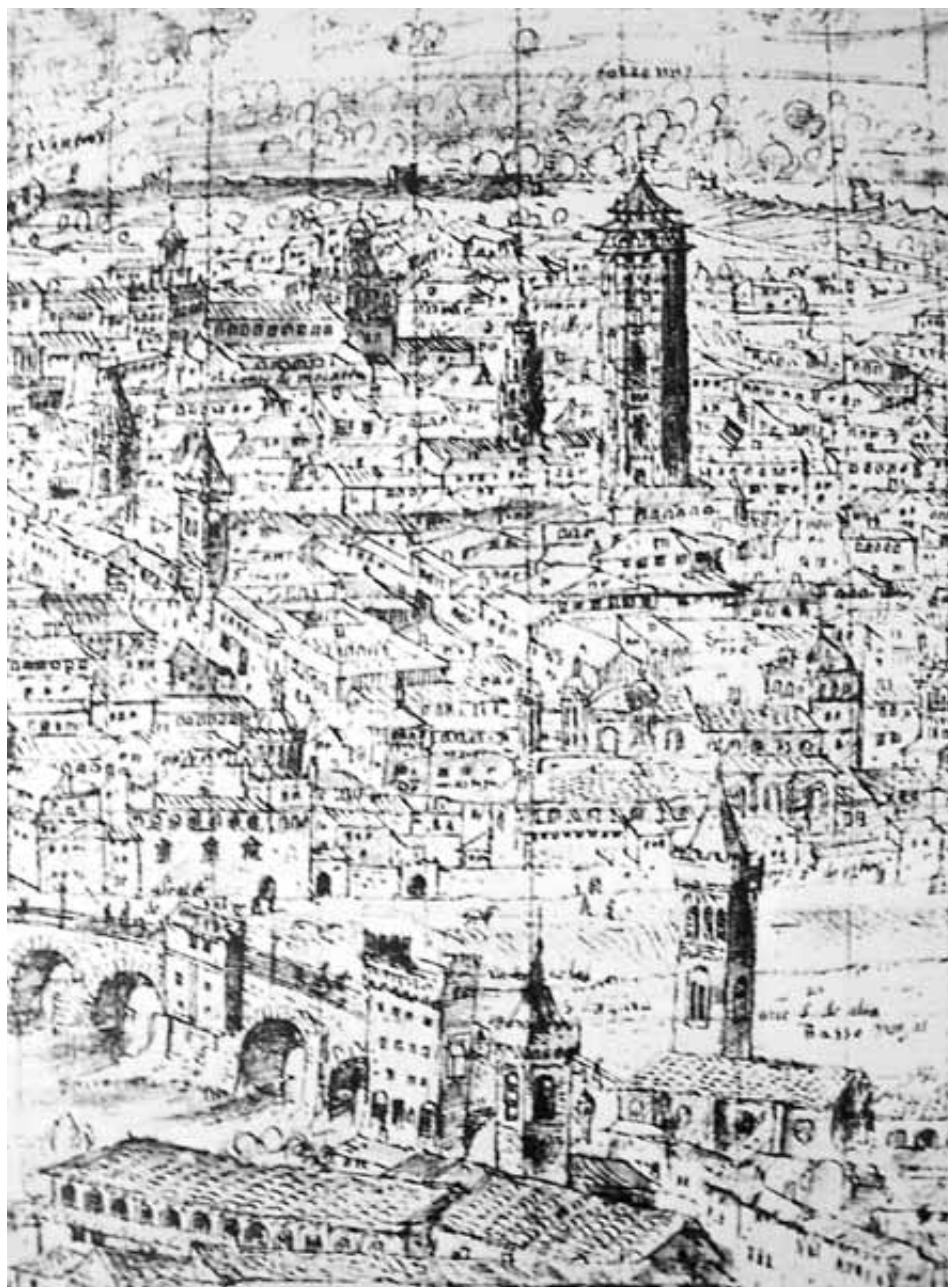
La Torre Nueva en la Zaragoza de 1563, según A. Van der Wyngaerde.