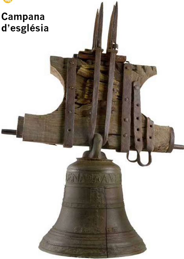
Campana d'església. MdT 1866.

NÚM. D'INVENTARI: MdT 1866 NOM DE L'OBJECTE: campana d'església MATERIALS: bronze, fusta i ferro FONEDOR: Gibert DATA: 1638 MIDES: total 91 x 70 x 38,5 cm de diàmetre PES CAMPANA: 33 kg aproximadament PROCEDÈNCIA: desconeguda