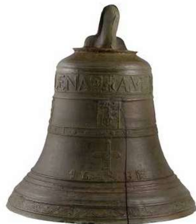
Imatge: Superfície de la campana vista a l'exterior del campanar.

No és en el present estudi on descriurem els passos de construcció d'una campana. Hi ha força bibliografia al respecte a la que ens remetem ( http://campaners.com ). Però sí cal assenyalar que era una tasca complexa i laboriosa que exigia sobretot experiència. Aquests coneixements i els utensilis del mestre fonedor (mestre campaner), s'acostumaven a transmetre de pares a fills, creant-se així un ofici hereditari de campaners que anaven allà on se'ls demandava. Les campanes solien a fondre's en el lloc, al peu o a prop del campanar. Prova d'això el tenim amb els dos motllos i dos forns per a campanes localitzats al claustre de Santa Maria (l'actual campana conservada en el campanar de l'església de Santa Maria porta la data de 1723), i un altre possible forn darrera l'absis de Sant Pere de Terrassa.