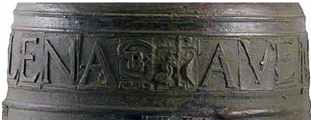
Banda epigràfica amb les dues cartel·les figurades, inici pregària mariana (escena dels pelicans) i final frase (segell del fonedor).