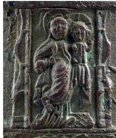
Imatge: Representació de la Verge i el Nen.

amb una aureola i vestits amb una túnica. La mà dreta de Maria sosté una esfera, símbol que representa el poder de Déu en el món. Altrament, l'objecte podria representar una poma, al·ludint al fet que la Mare de Déu no va caure en la temptació del pecat degustant el fruit, contràriament a Eva, enganyada per la serp (Mata, 2014, p. 79 – 86) en l'episodi del Gènesi.