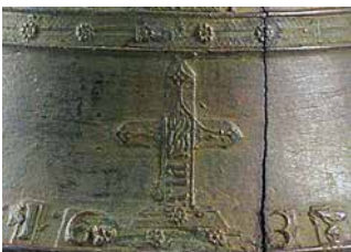
Imatge: Creu amb pedestal i data de la fosa, 1638.

A banda i banda del pedestal de la creu, es disposen els números 16 i 38, que correspon a la data de fosa de la campana: any 1638.