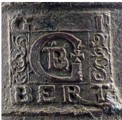
Imatge: Segell del fonedor GIBERT.

La marca del fonedor consisteix en la signatura figurada del seu nom, «Gibert», que es desplega sencer entre la part superior i inferior de la cartel·la. En el motiu central, situat entre dues sanefes florals que es despleguen al marge dret i esquerre, l'artesà també plasma el seu nom mitjançant la superposició de les lletres majúscules, que poden interpretar-se sobre els dos traçats amb els que es constitueix el motiu.