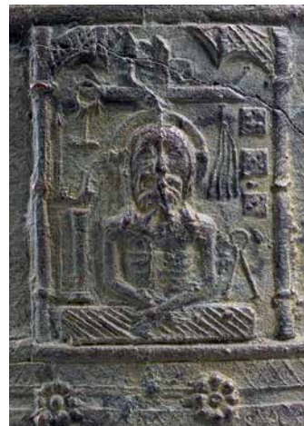
Figura de l'eccehomo i els elements identificadors de la Passió.

Entès així gràcies a la iconologia amb què es constitueix el motiu, que dona a entendre que es tracta de la representació dels episodis evangèlics denominats com la Passió de Crist, escrits pels evangelistes Lluç (22-23), Joan (18-9), Marc (15) i Mateu (27). La Passió narra la condemna de Jesucrist i es constitueix entre l'escena de l'últim sopar i la seva mort, crucificat. L'escena s'emmarca dins d'una decoració arquitectònica tridimensional clarament gòtica, dosseret.