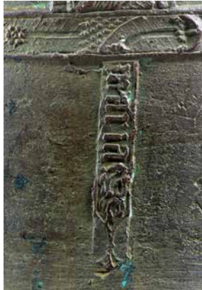
Detall de la beta que envolta el mig de la campana i la sivella. Just sota d'aquesta, tros penjant amb cingol i llegenda en lletres gòtiques, "maria".