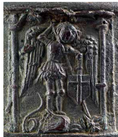
Imatge: L'Arcàngel Sant Miquel matant al drac.

Retallada per la part superior. Un àngel vestit amb armadura, amb traços clarament gòtics, amb llança a la mà dreta i sostenint un escut amb l'esquerra. Als seus peus i clavant-li la llança hi ha un drac vençut. La imatge descrita evoca una escena de l'episodi de l'Apocalipsi, comunament representada en la iconologia religiosa cristiana. Es tracta de la figura de l'arcàngel Sant Miquel expulsant Satanàs de la terra (la figura del drac), després que el primer, liderant els exèrcits celestials, guanyés la batalla contra els àngels rebels dirigits pel segon (Apocalipsi, 12). Arran de l'escena bíblica, l'Arcàngel Miquel és reconegut per l'església catòlica com l'oponent directe de Satanàs així com l'encarregat de la salvació de les ànimes en el moment de la mort de l'àngel caigut.