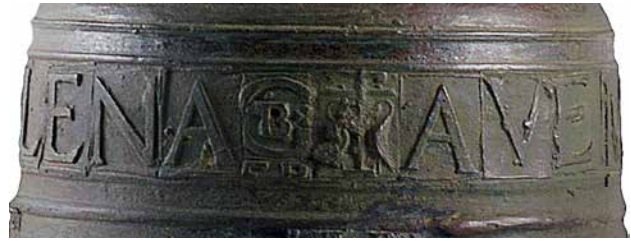
Imatge: Banda epigràfica amb les dues cartel·les figurades d'inici pregària mariana, escena dels pelicans, i al final text, segell del fonedor.

Fusta de pi resinós, potser de pinyoner, de talla asimètrica i d'una sola peça (braç i contrapès). De secció quadrada. Conserva la ferralla de reforç i les tiges llargues que sostenen la campana per la nansa. Hi destaca també el doble suport de la palanca per al toc.